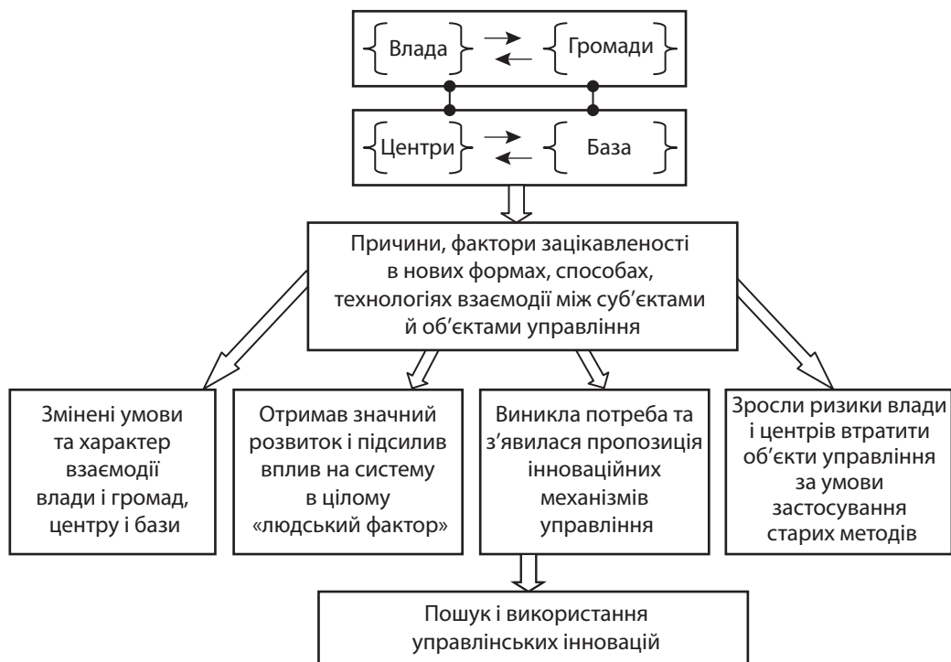
Рис. 2. Зміщення акцентів уваги від традиційних форм управління до інноваційних

довела, що такий спосіб державного стратегічного регулювання є високоефективним. Зараз у роботі з формування нових районів у масштабах обласних меж така стратегія не береться до уваги та не враховується. Не будемо це відносити до помилки або недалекоглядності реформаторів, але в науковому розгляді проблеми завдання «особливостей» району, території має право на увагу. Особливі умови, особлива територія, особливі сценарії розвитку.