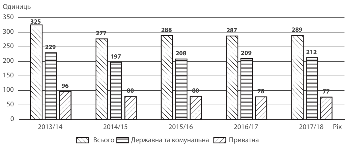
Рис. 2. Кількість ЗВО України III–IV рівнів акредитації за формами власності станом на початок відповідного навчального року, од.