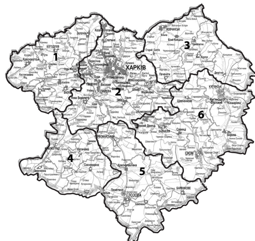
II – 6 районів