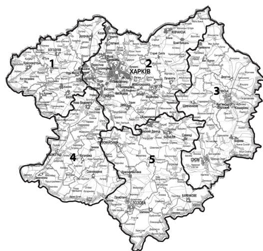
IV – 5 районів