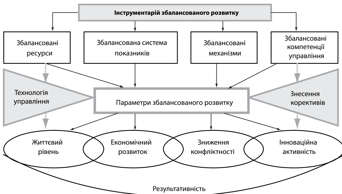
Рис. 2. Модель забезпечення збалансованого розвитку нових районів

Субурбанізаційна стратегія в моделі укрупнення районів не відпрацьована, вона ще потребує своєї розробки, але вже в постановочному плані можна визначити деякі її характеристики і особливості.