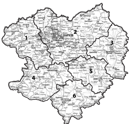
III – 6 районів