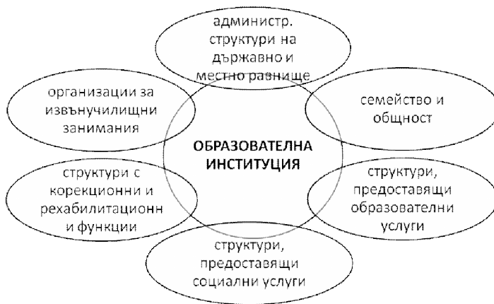
Фиг. 1. Субекти на социалнопедагогическа работа в училище

Като мащабна дейност, преследваща важни за цялото общество цели, социалнопедагогическата работа се явява функция и ангажмент на много субекти в общественото пространство. Ключова роля сред тях има училището и то основателно се възприема като основен възпитателен и образователен фактор в системата от институции. Комплексният характер на възпитателната и социализиращата дейност обаче изисква училището да търси партньорството и да влиза във взаимодействие с много външни за него субекти, които имат непосредствено или косвено отношение към възпитанието на подрастващите. Така образно може да се обособят две групи субекти на социалнопедагогическата работа – от една страна, училището, и от друга, външните за него структури, които участват под различни форми в образователно-възпитателния процес.