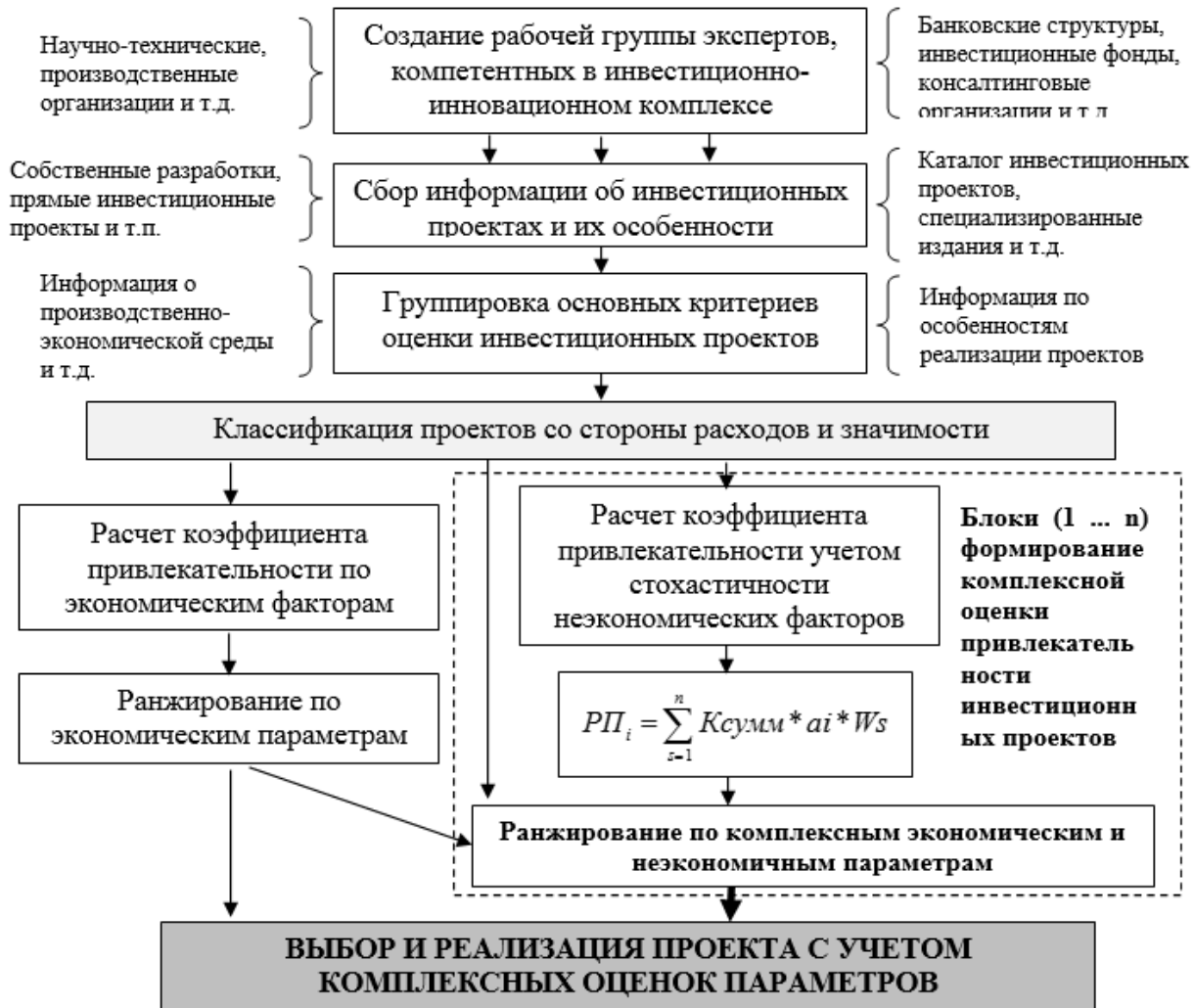
Рисунок 1 - система выбора наиболее привлекательных проектов на основе комплексного подхода

оценочных показателей инвестиционной привлекательности с учетом действия внеэкономических факторов.