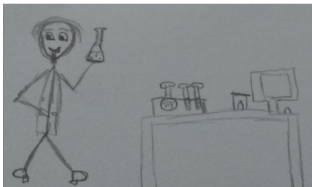
Figura 6. Desenho de Aa1.