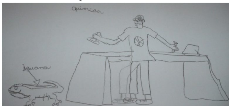
Figura 8. Desenho de Ao10.

os pesquisadores vinculados às áreas de ciências humanas (KOSMINSKY; GIORDAN, 2002).