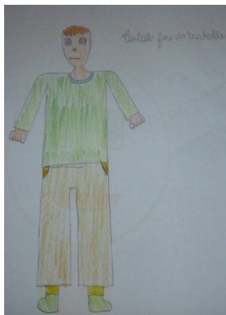
Figura 7. Desenho de Ao8.

Nessa unidade de análise, apresentam-se os desenhos de cientistas distante dos estereótipos propostos nos outros desenhos. Como indicadores, foram utilizados: roupa casual, o desenho de uma iguana e o símbolo da paz, como pode-se observar nas Figuras 7 e 8.