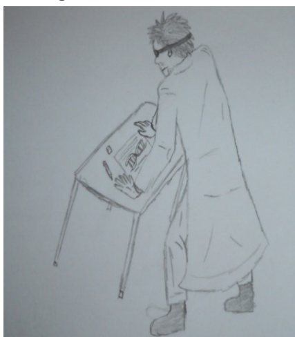
Figura 11. Desenho de Ao15.

Estereótipos são artifícios utilizados pelas mídias como estratégia para poupar processamento nas mentes de seus interlocutores, pela facilidade de atingir objetivos comunicacionais. Conceitos já arraigados, acomodados, são fáceis de acessar e difíceis de mudar. Assim, os meios de comunicação agem reforçando as ideias já ancoradas como representação social vigente no universo do senso comum preferencialmente a lançar ideias e conceitos novos (CRUZ, 2007, p.03).