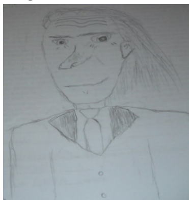
Figura 10. Desenho de Ao14.

Nessa unidade de análise encontra-se a representação de cientista por meio de personalidade científica. Albert Einstein ainda é considerado o estereótipo de cientista, apesar de ter sido desenhado por apenas um aluno dentre os quinze. Contudo, entendemos que a imagem estereotipada de Einstein é utilizada por muitos estudantes para representar a profissão de cientista (FORT; VARNEY, 1989), como pode ser observado na Figura 10.