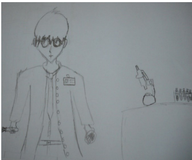
Figura 1. Desenho de Aa6.

Essa pouca representação da mulher na ciência ocorre devido a toda uma cultura apresentada à criança, seja pela família ou pela mídia que, mesmo despropositadamente, acolhem o estereótipo masculino na ciência (CAVALLI, 2017). Utilizamos como indicadores nessa unidade de análise cabelo curto, gravata, roupa e ainda o pronome masculino utilizado nas frases escritas pelos alunos. O gênero do desenho também foi confirmado durante a discussão que se realizou posteriormente aos desenhos. A quantidade predominante de desenhos masculinos demonstra que a ciência e o estereótipo de cientista são masculinizados, voltados ao entendimento de uma ciência androcêntrica (AQUINO, 2006). Pode-se observar, na Figura 1, um desenho que se enquadra nessa unidade de análise.