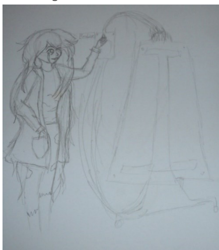
Figura 2. Desenho de Aa7.

número reduzido de desenhos de cientistas mulheres pode ocorrer devido à associação das mulheres apenas às áreas de humanas, como cita Leta (2003). Assim, como a ciência em geral é pensada vinculada às áreas de exatas como Química e Física, ocorre a prevalência de desenhos com representação de cientistas homens. Nas Figuras 2 e 3, pode-se observar os dois desenhos que representaram a figura feminina como cientista.