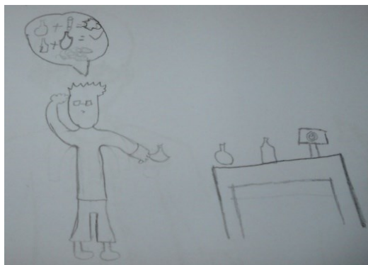
Figura 5. Desenho Ao12.

cabelos desarrumados e barba mostram uma pessoa que não tem tempo para vaidade, bem como a cor grisalha pode representar sabedoria (REZNIK, 2014).