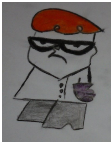
Figura 9. Desenho de Aa13.