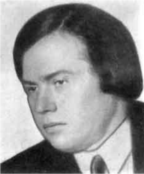
Рис. 2. Поэт Владимир Кириллов

Надо сказать, что с началом Гражданской войны белое командование демонизировала революционных матросов, чему способствовали их зверства и разорения церквей в Новочеркасске и Донской области.