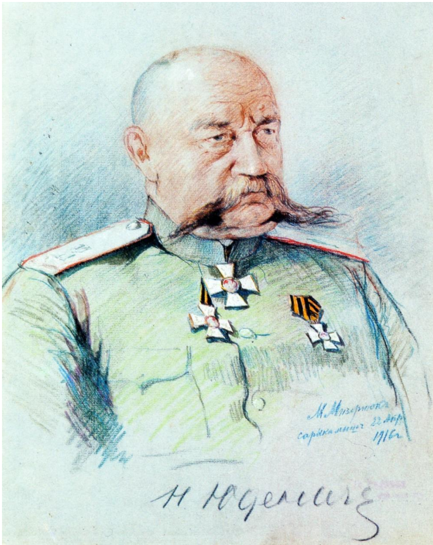
Рис. 3. Н.Н. Юденич один из главных противников пропаганды Балтфлота

Вы слышите, красные моряки, что надежда нашего врага только в том, что в самом Кронштадте могут вспыхнуть беспорядки. Будут, где угодно, только не в нашем русском советском флоте. Мы гарантируем, господа белогвардейцы, что в течение ближайшего времени мы можем стать свидетелями крупнейших движений и в английском флоте, как видели это восстание не так давно и во французском флоте. Но мы ручаемся вам, что никаких восстаний, никаких волнений не будет в нашем красном флоте» (Lukashevich, 1919).