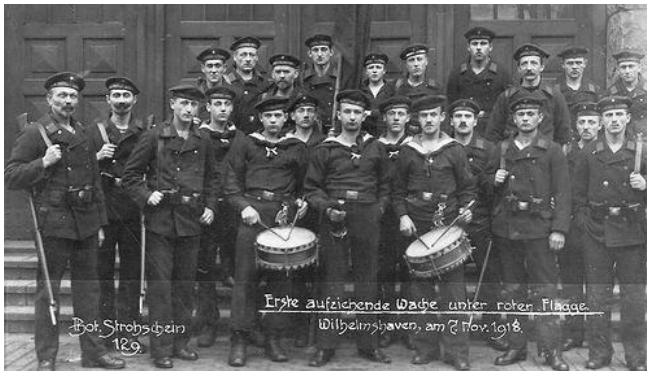
Рис. 4. Германские революционные матросы