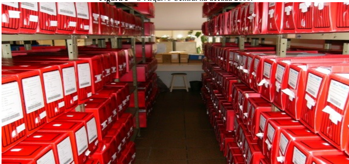
Figura 3 - O Arquivo Central na década 2000.