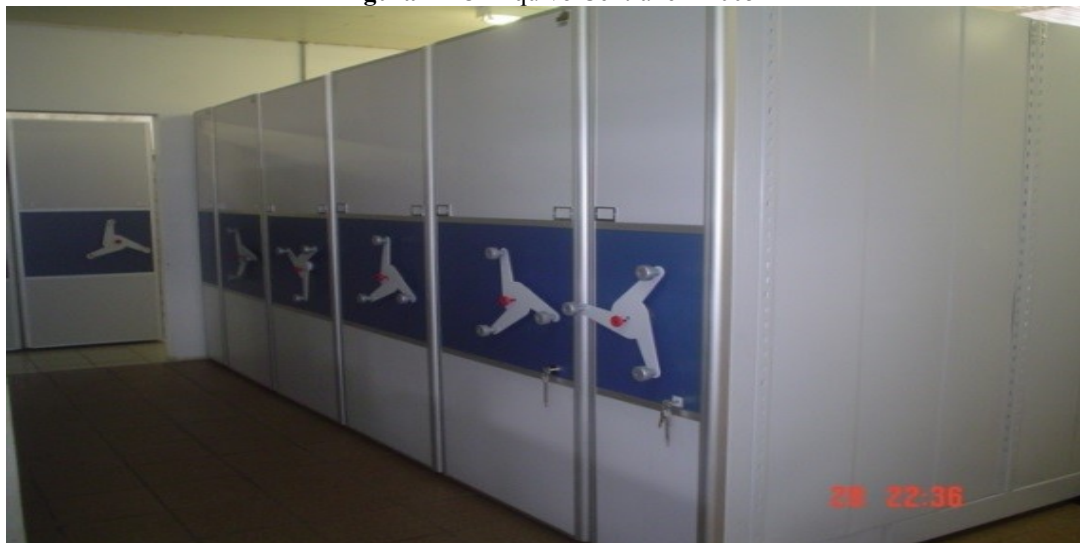
Figura 4 - O Arquivo Central em 2005