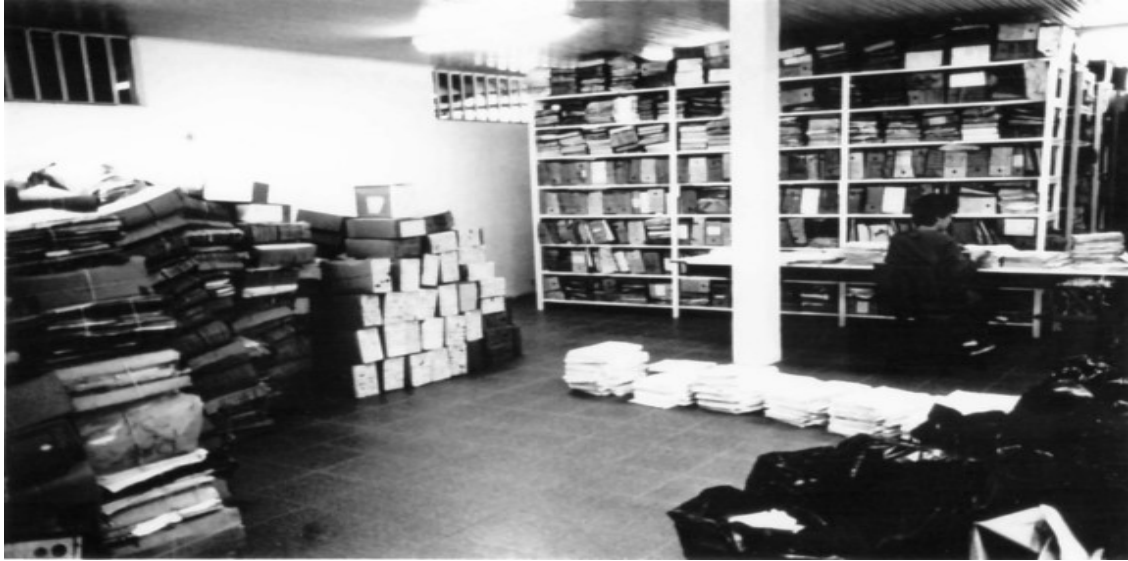
Figura 1 - O Arquivo Central na década de 1980