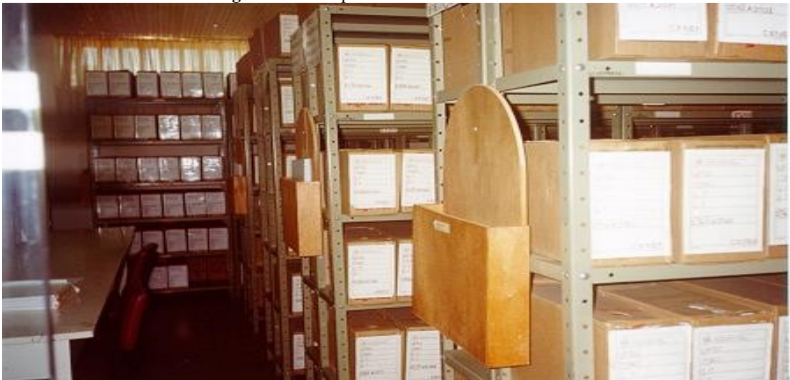
Figura 2 - O Arquivo Central na década de 1990