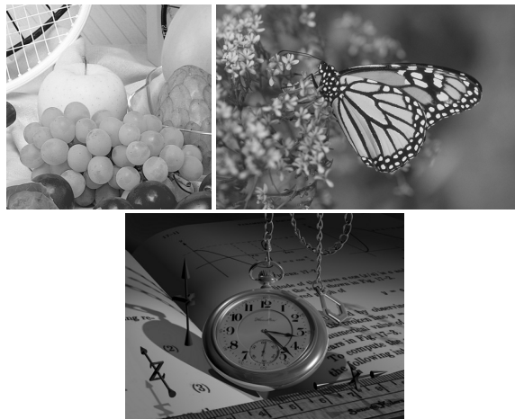
Рис. 2. Исходные изображения

Экспериментально было установлено, что для фиксированной обучающей выборки, построенной по трём изображениям (рис. 2), изменение глубины сети (добавление полносвязных скрытых слоёв) негативно воздействует на качество интерполяции. В частности, было опробовано добавление скрытого слоя с активационной функцией RELU между 2-м и 3-м слоем, а также удаление 2-го слоя.