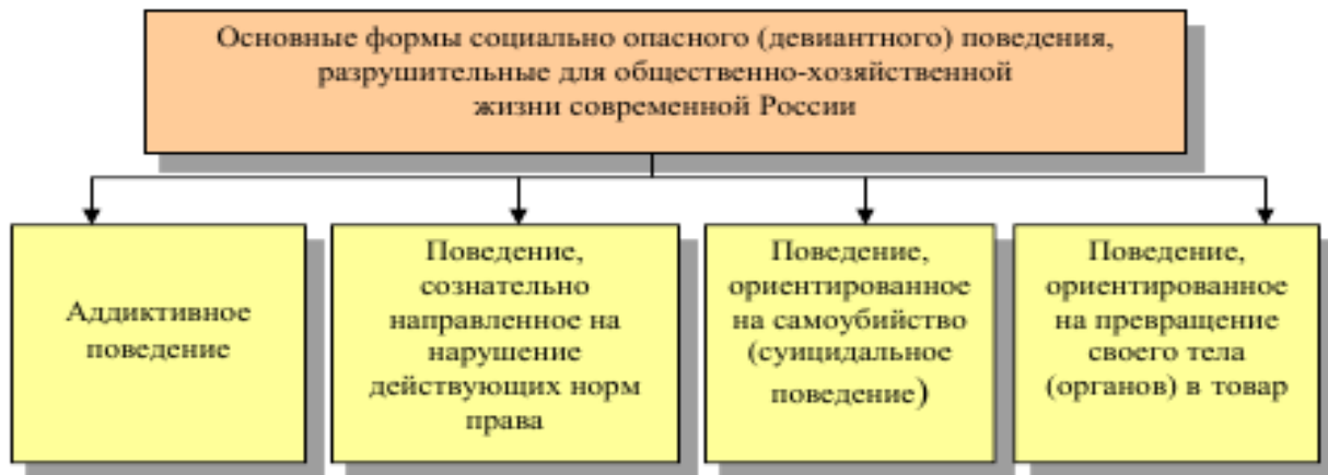
Рис. 2. Формы социально опасного (девиантного) поведения (Буйлова, 2019)

Каждый из мегатрендов несет в себе будущие возможности и угрозы для жизнедеятельности наших современников. Например, мегатренд, связанный с ускоренной урбанизацией вызывает к жизни различные психические расстройства у городского населения в силу ускоренного ритма жизни, необходимости постоянно соответствовать определенным правилам, что может приводить к нервным стрессам и как следствие к возникновению социально опасного (девиантного) поведения (Рисунок 2).