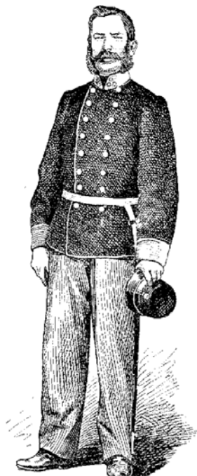
Slika 2. Ravnatelj pučke škole u Vojnoj krajini (A. Cuvaj, 1920., 2.sv., str. 492)

Školske godine 1875./76. u školi su se učili sljedeći nastavni predmeti: vjeronauk, hrvatski jezik, računstvo, realna obuka: zemljopis, povijest, prirodopis i prirodoslovlje, zatim krasopis, „risanje i geometrijsko oblikoslovlje, pjevanje crkvenih i lagljih domorodnih pjesama, tjelovježba, ženski ručni rad, gospodarstvo i kućanstvo“. 29