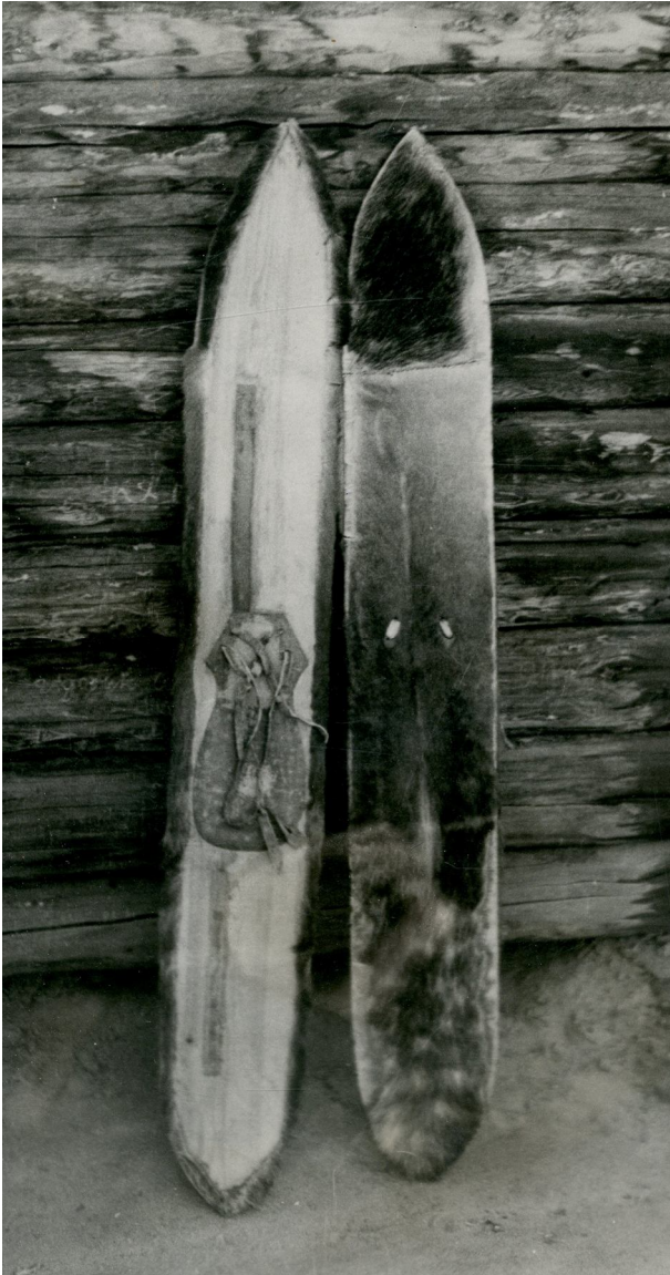
Рис. 4. Охотничьи лыжи. Пос. Холодная, Северо-Байкальский район, 1962 г.