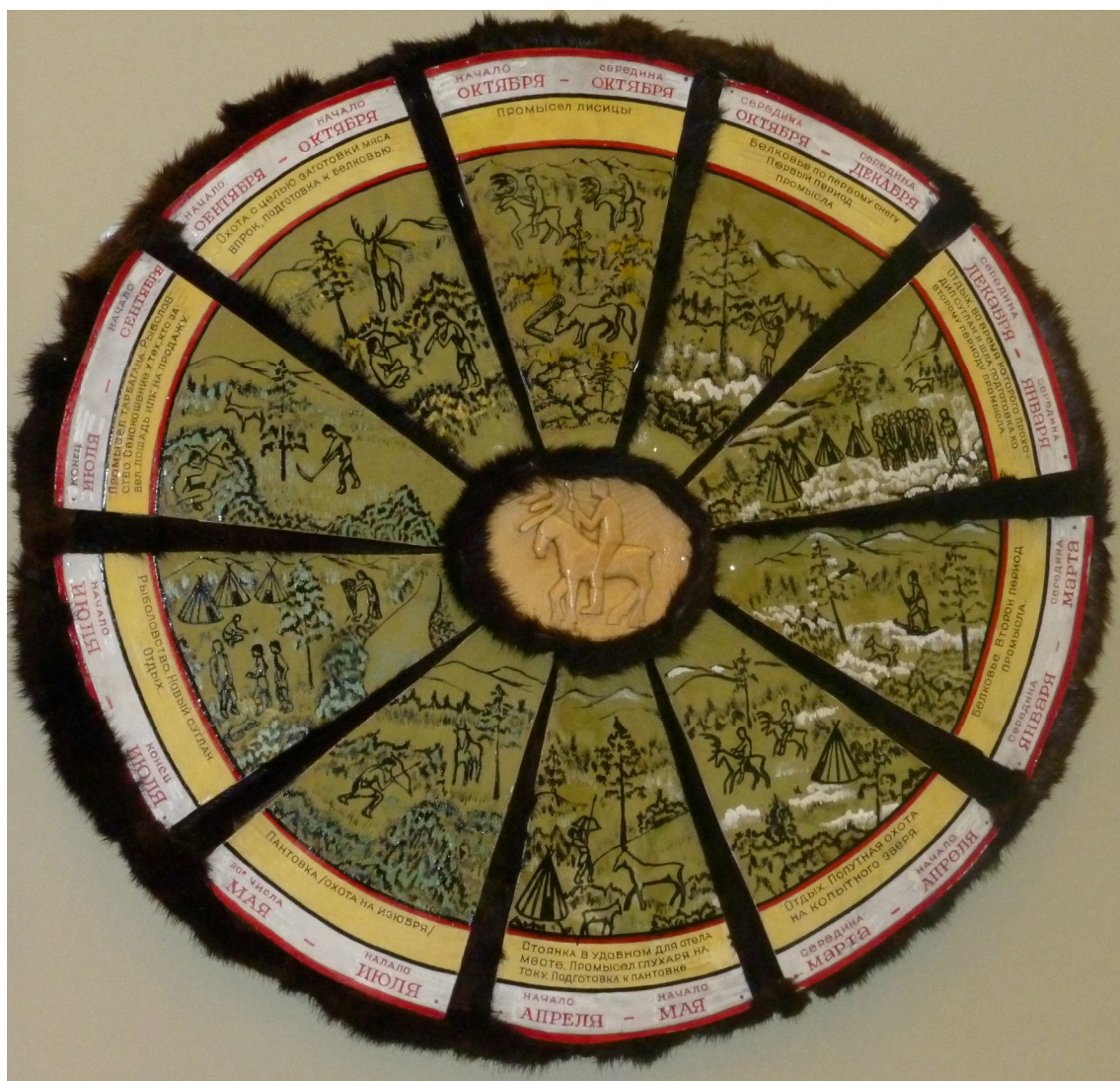
Рис. 3. Календарь баунтовских эвенков (из фондов Музея народов Севера Бурятии, с. Багдарин, Баунтовский район, 2004 г.)