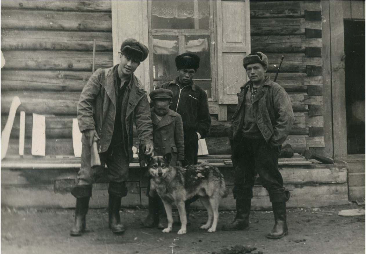
Рис. 5. Охотники. Пос. Холодная, Северо-Байкальский район, 1962 г. (ЦВРК ИМБТ СО РАН. ОФ. Д. 1249а. № 141) Fig. 5. Hunters. Settl. Holodnaya, North-Baikal region, 1962 (СОМХ ИМВТS SB RAS. OF. D. 1249а. No. 141)

В советское время пушная охота становится товарной отраслью в экономике промысловых хозяйств, колхозов, совхозов. Существовало 3 категории охотников: штатные, внештатные, любители. Тайга была поделена на охотничьи участки, на которых были построены зимовья, было организовано снабжение оружием, боеприпасами.