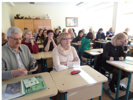
9 pav. Seminaras