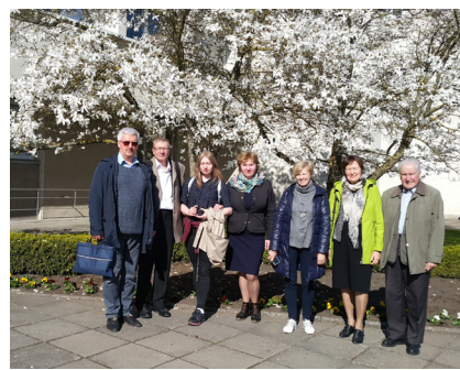
6 pav. Konferencijos dalyviai prie miesto savivaldybės

Išvyka laivu užtruko ilgiau nei planuota, laivas į uostą grįžo jau sutemus. Tačiau konferencijos dalyviai neskubėjo skirstytis, dalijosi išpūdziais, aptarė ekskursijos išpūdzius.