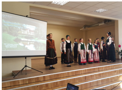
4 pav. Muzikinis mokyklos moksleivių sveikinimas