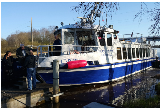
10 pav. Konferencijos dalyvių išvyka laivu