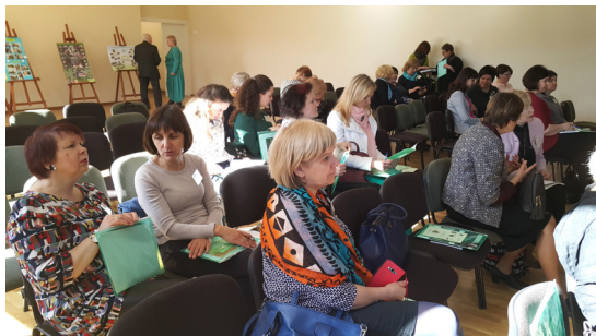
3 pav. Konferencijos dalyviai