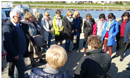
7 pav. Improvizuota geologijos pamoka