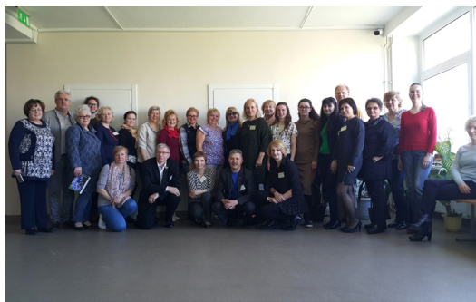
12 pav. Konferencijai pasibaigus

Įvertinant konferencijos dalyvių nuomones bei vertinimus, galima teigti, kad seminarai buvo naudingi mokytojams. Tikėtina, kad tam tikrą didaktinę patirtį mokytojai galės pritaikyti ir savo darbe.