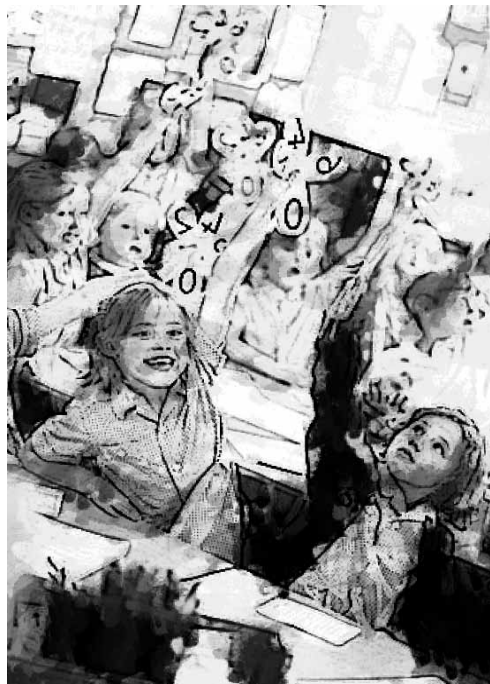
Imagen 5. Brazos levantados, no por rebelión; si no para ser autorizados a responder.

Sé asignaba un texto escolar para la materia y debíamos aprenderlo “al pié de la letra” h , la memoria era indispensable. Eran los días del método mutuo o de Lancaster o método inglés: férrea disciplina y premio y castigo. Este sostenía que los alumnos van a la escuela a adiestrarse y a aprender, a repetir lo que la jerarquía —que era el profesor— enseñaba. No se hablaba sin permiso, que se obtiene levantando el brazo y el profesor señalaba quien “tenía la palabra” y solo así estaba autorizado para contestar.