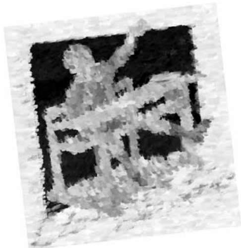
Imagen 2. Scriverio Madera y “un amigo fiel”.

Eventualmente mientras “mis amigos fieles” se desplazaban camino al colegio, se cruzaban con él cuando primero en su bicicleta, después en su moto y finalmente en carros de diferentes modelos se detenía unos minutos para animarlos a seguir y no desfallecer en sus estudios. Desapareció un tiempo indeterminado y, cuando regresó ahora sí “muy maduro”, elegante, portentoso, serio, adinerado, voluptuoso, sano, envidiado, rico, bilingüe y muy bien ataviado.