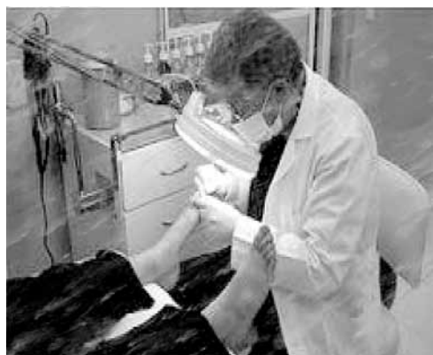
Imagen 4. Uña encarnada (Onicocriptosis)- Onicectomía.