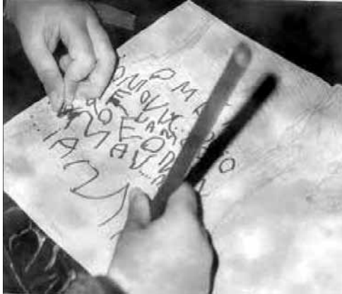
Imagen 6. ¿Escritura pegada o despegada, esa es la pregunta?

Para ampliar el debate, se debe tener en cuenta los argumentos fisiológicos, médicos, psicológicos, prácticos, de estado de ánimo, de tiempo disponible y otras características que no avalan la exigencia única de escribir con letra pegada y convierten esas pretensiones transformadoras en directrices intrascendentes.