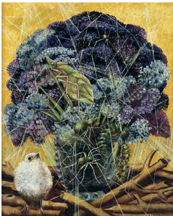
Fotografía tomada del libro Frida Kahlo. 2014. Obra: “El polluelo, 1945 Oleo sobre aglomerado”

(2007, 3): “Las palabras pueden emplearse también para ocultar la realidad (...) el principal instrumento de manipulación es el lenguaje” y es desde éste que cada uno de los maestrantes ha vivido la experiencia en su trasegar histórico, transfiriendo en su ejercicio pedagógico el miedo denotado con la imposición del poder en el aula, con actitudes amenazantes, subestimación del saber del otro, no propiciar espacios de diálogo y no arriesgarse a