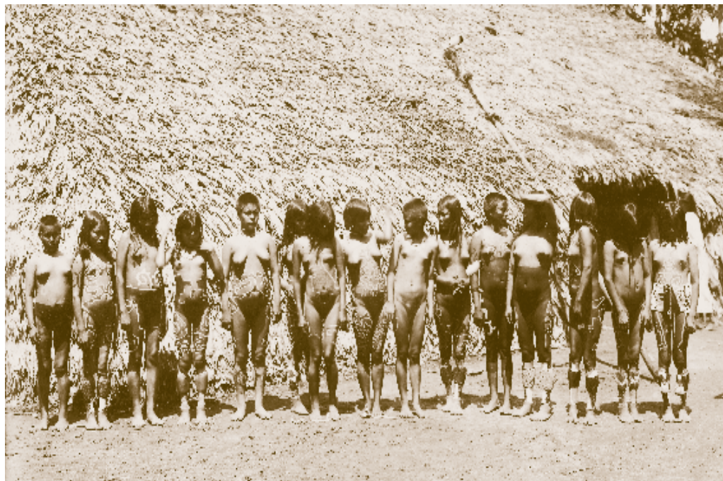
Ilustración 1 - Fotografía Mujeres Uitoto.