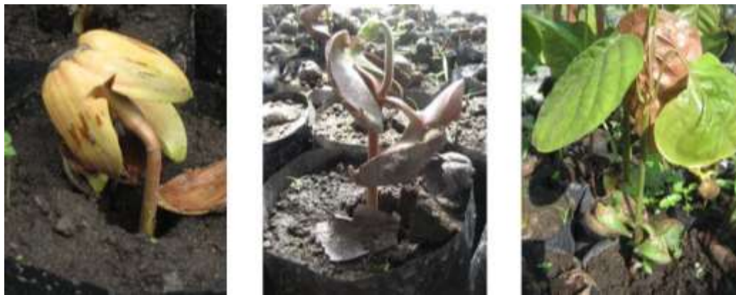
Gambar 2. Pertumbuhan semai tengkawang

Tahapan pertumbuhan semai dari jenis-jenis tersebut dapat dilihat pada Gambar 2. Semua pengamatan karakter dalam penelitian ini dilakukan setelah semai berumur 10 bulan dan sudah siap tanam.