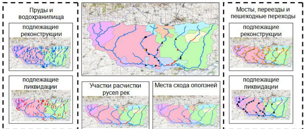
Рис. 3. ГИС-проект бассейна р. Тузов: структура тематического слоя «Первоочередные мероприятия»