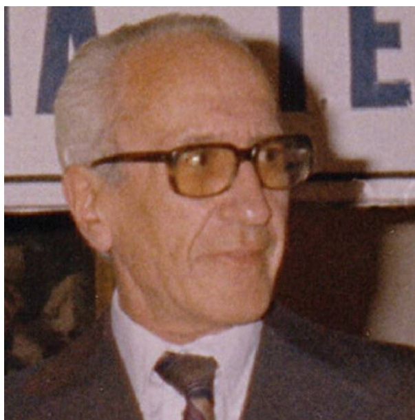
FIGURA 1.1. Alberto P. Calderón

Calderón fue uno de los más originales y profundos analistas de los últimos 50 años.