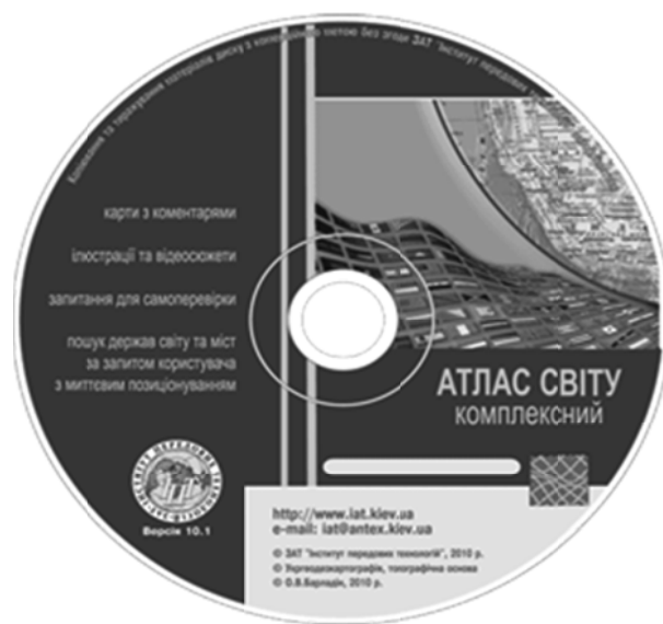
Рис. 2. Навчальний атлас на CD-дискі

Створення атласів, посібників і карт на CD-дисках триває й досі. Крім ІПТ, їх створенням та реалізацією займаються ДНВП «Картографія» та ТОВ видавництва «Ранок», хоча останні не видають дисків з географії. Серед зарубіжних видавництв у цьому сегменті слід виділити видавництво «Дрофа» у Російській Федерації, яке видає інтерактивні карти, атласи і посібники з географії.