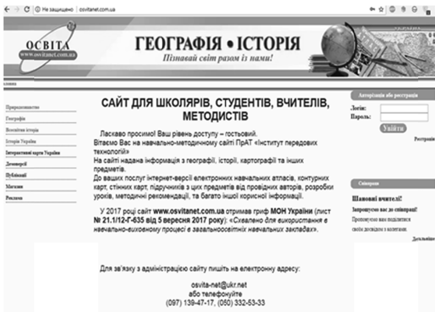
Рис. 3. Головна сторінка сайту http://osvitanet.com.ua