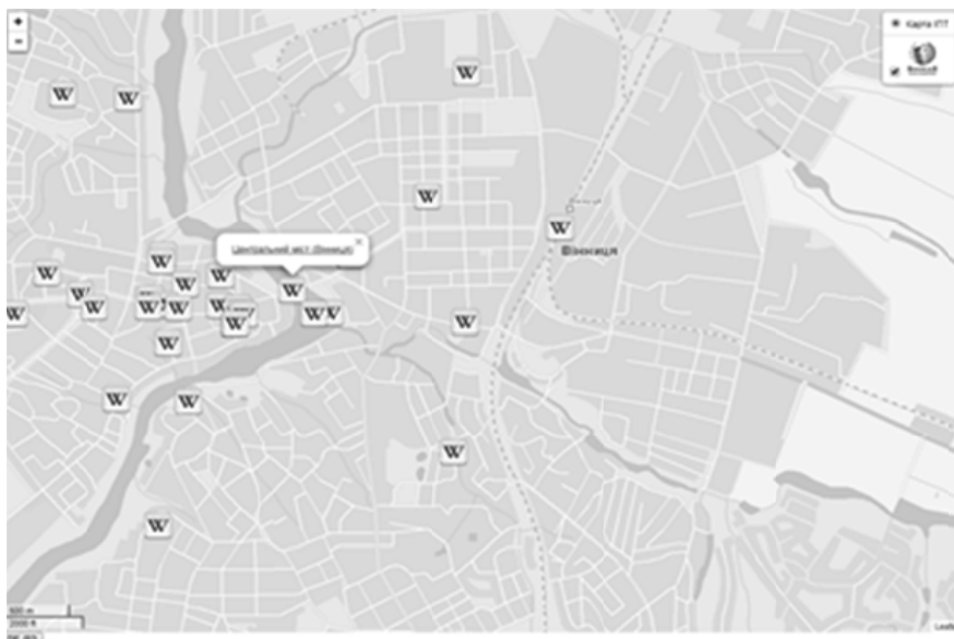
Рис. 6. Вікіпедія на карті