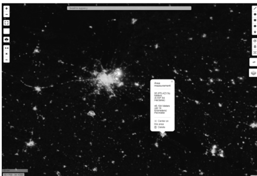
Рис. 8. Використання космознімку та інструмент вимірювання площі