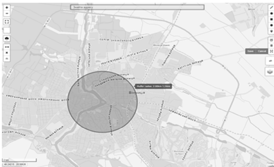
Рис. 7. Універсальна інтерактивна веб-карта