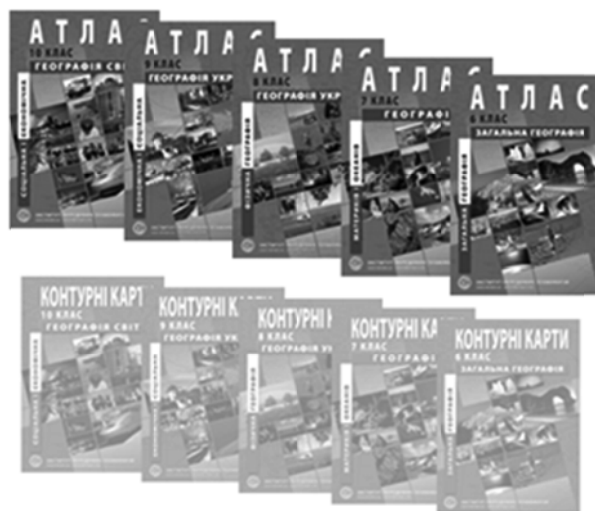
Рис. 1. Лінійка паперових навчальних атласів

Згодом відбулось наповнення таких карт і атласів мультимедійним контентом — текстами, зображеннями та тестуванням для навчальних атласів (рис. 2) та різними робочими інструментами (для малювання тощо). Основною продукцією даного виду став великий тираж навчальних атласів на CD-дисках з географії, історії України та Всесвітньої історії.