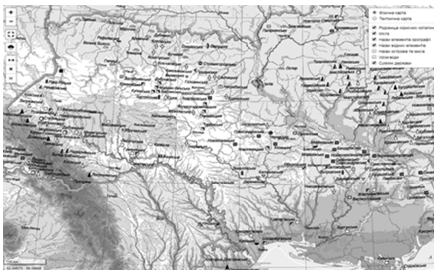
Рис. 4. Інтерактивна «Фізична карта України»