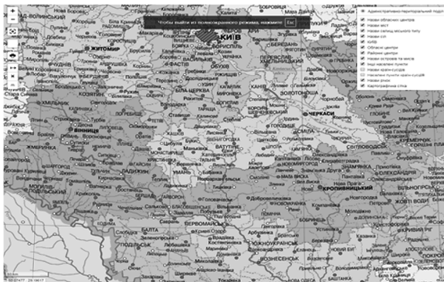
Рис. 5. Інтерактивна «Адміністративна карта України»