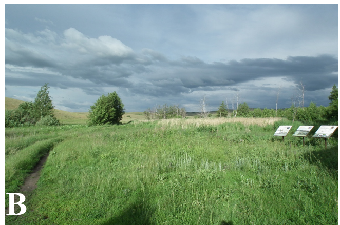
Рис. 2. Биотопы живородящей ящерицы Zootoca vivipara на участке «Буртинская степь»: А – луг вокруг родника Кайнар, В – луг рядом со стационаром.