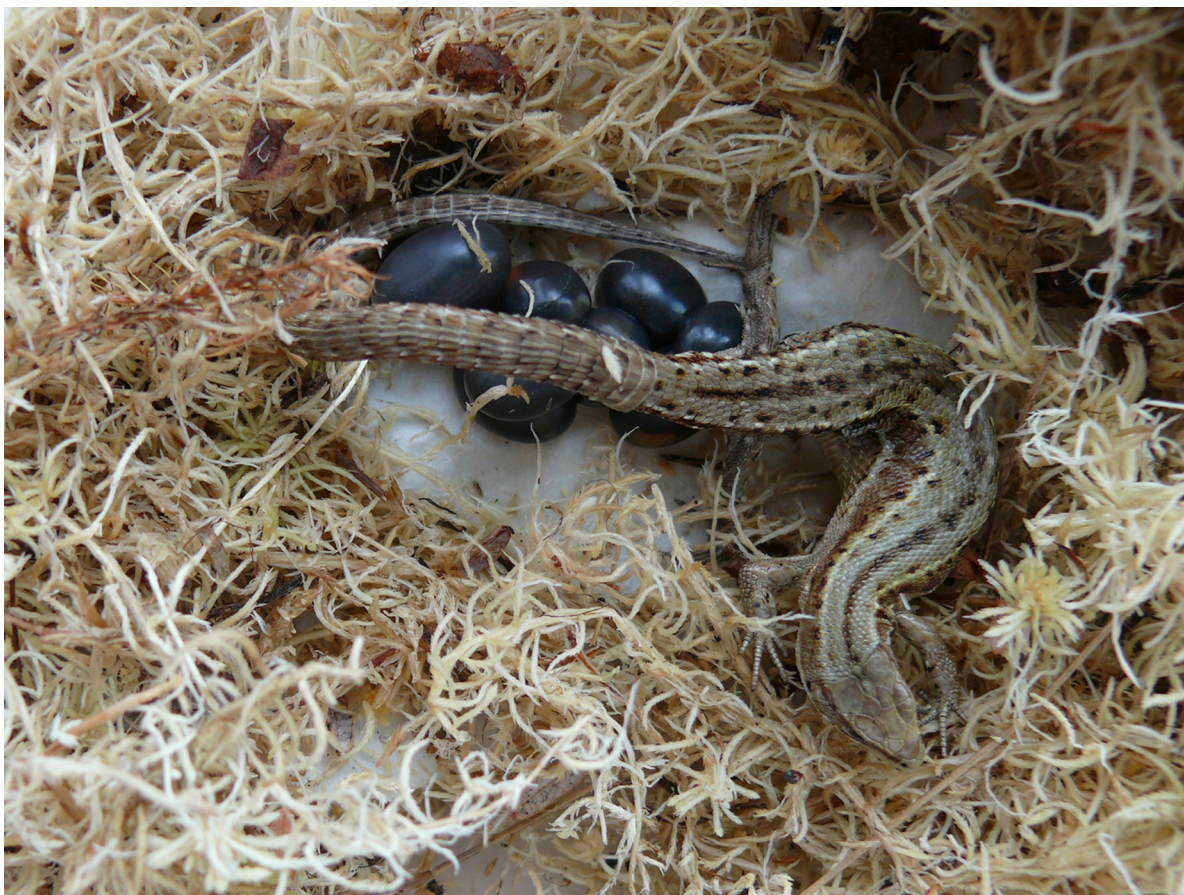
Рис. 4. Самка живородящей ящерицы Zootoca vivipara с кладкой яиц.

Всего в выводках восьми самок было 73 новорожденных. Средняя плодовитость ящериц из «Буртинской степи» составила 9.1 \pm 0.77 эмбрионов на самку. Этот показатель значимо выше, чем у ящериц из большинства популяций обеих живородящих клад со всего ареала (Roitberg et al., 2013). Близкие к исследованной нами «оренбургской» выборке значения среднего числа детенышей отмечены в популяциях из Средней и Восточной Европы (юго-восток Германии, Польша, Украина), Среднего Поволжья, а также Южной Сибири (Хакассия). Таким образом, можно отметить факт более высокой плодовитости в южной части ареала, требующий дополнительных исследований и подтверждения.