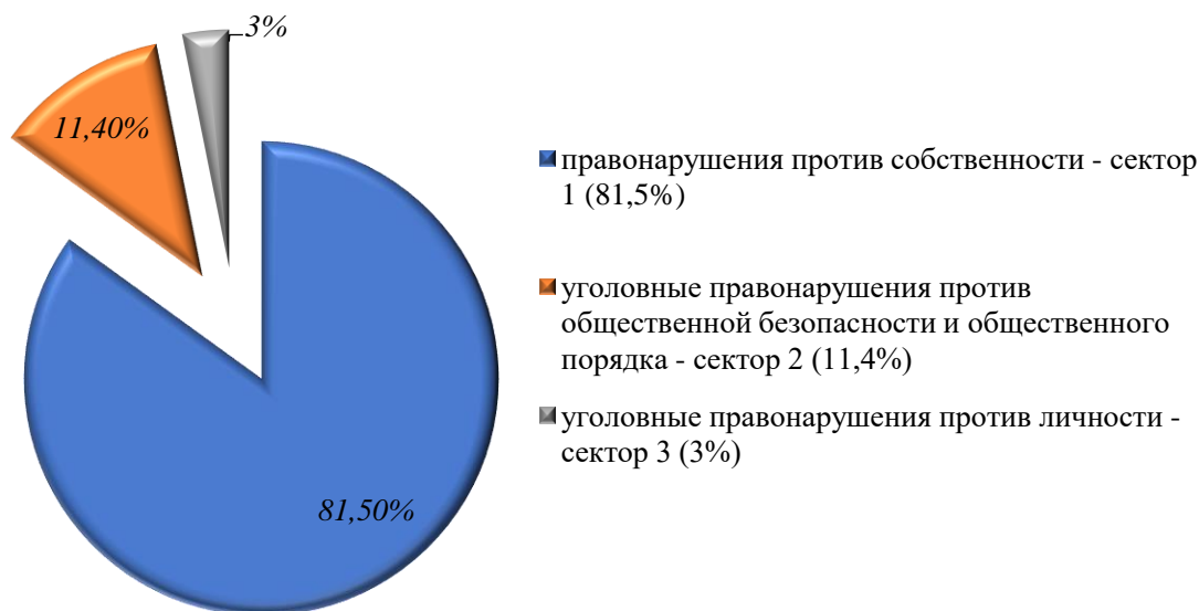
Рисунок 2. Структура уголовных правонарушений, совершенных в общественных местах в Республике Казахстан, за 2016 год

Статистические данные за 2016 год (Рисунок 2) показывают, что удельный вес отдельных видов уголовных правонарушений, совершенных в общественных местах, представлен следующим образом: уголовные правонарушения против собственности — сектор 1 (81,5%), уголовные правонарушения против общественной безопасности и общественного порядка — сектор 2 (11,4%), уголовные правонарушения против личности — сектор 3 (3%).