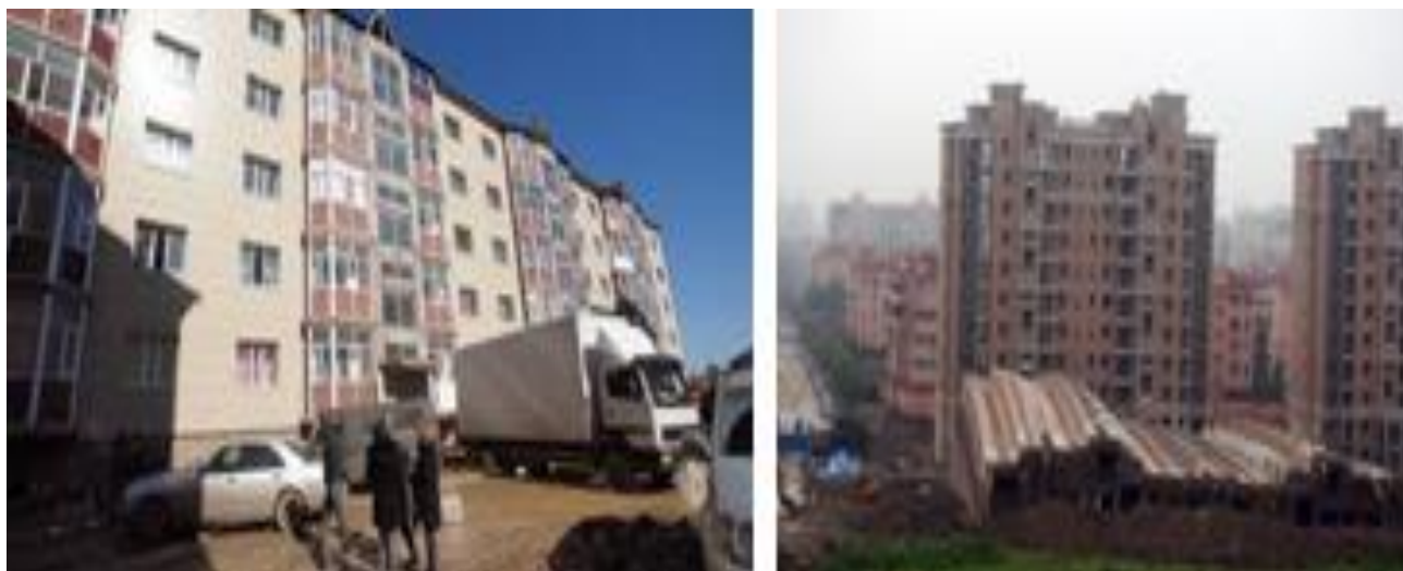
Рисунок 1. Накренившиеся и обрушенные дома в 2011 г.: a — 5-ти этажные дома города Караганды и б — 13-этажный опрокинутый дом в городе. Шанхай.

Весной 2011 года из-за проникания грунтовых вод к области фундаментного основания новый дом города Шанхай Китая высотой 13 этажей тоже сначала накренился и затем быстро обрушился с падением. Состояние перед обрушением дома микрорайона «Бесоба» города Караганды и дома после падения–обрушения города Шанхай показаны на Рисунке 1.