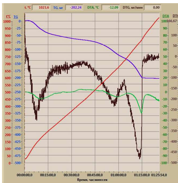
Рис. 2. Дериватограмма бокситового шлама

тов гидратации основного минерала шлама двухкальциевого силиката – белита \beta - 2\text{CaO}\cdot\text{SiO}_2 , что согласуется с результатами работы [3]. По эндотермическому эффекту при 100\text{--}250^\circ\text{C} на кривой ДТА можно судить об удалении физически связанной воды из бокситового шлама. На кривой ДТА эндоеффект при 550\text{--}700^\circ\text{C} свидетельствует о дегидратации гидросиликатов кальция, а эндоеффект при 800\text{--}900^\circ\text{C} характеризует наличие в бокситовом шламе вторичного карбоната кальция \text{CaCO}_3 , который претерпевает термическую диссоциацию по схеме \text{CaCO}_3 \rightarrow \text{CaO} + \text{CO}_2 .