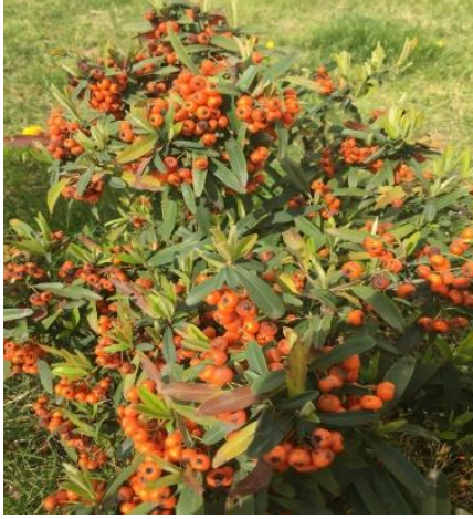
Şekil 2: Pyracantha coccinea (ateş diken) bitkisi.