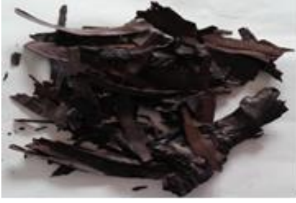
Şekil 1: Alkanna tinctoria (havaciva) bitkisinin kurutulmuş rizomları.

kâğıdından süzülerek stok olarak kullanılmak üzere koyu renkli cam şişe içerisinde buzdolabında +4 °C'de saklanmıştır.