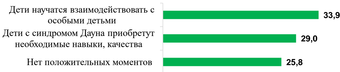
Рис. 2. Преимущества совместного дошкольного обучения обычных детей и ребенка с синдромом Дауна по мнению родителей (в % от числа ответивших; допускалось несколько вариантов ответа; ранжировано по убыванию)

интересна и тем, и другим, материал должен быть наглядным. Для воспитателя стало труднее, так как, больше времени уходит на подготовку занятий. В то же время, воспитатель может наблюдать за результатом воздействия на детей: добился ли он того, что дети стали более милосердными и доброжелательными по отношению к особым детям?» (воспитатель инклюзивной группы д/с №4).