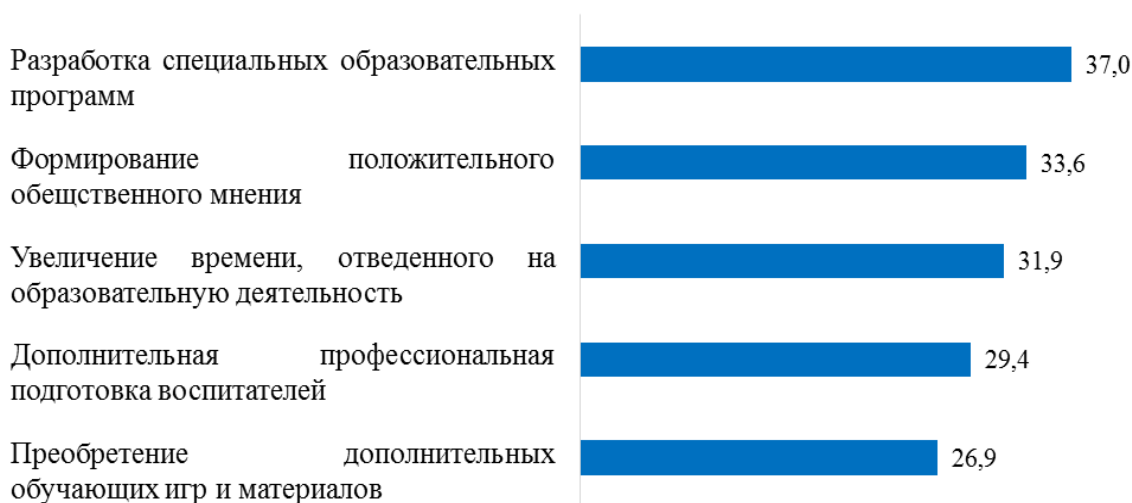
Рис. 1. Условия введения инклюзивного образования в детских садах, по мнению родителей (в % от числа опрошенных родителей детей обычной группы детского сада; допускалось несколько вариантов ответа; ранжировано по убыванию)

Родители обычных детей в качестве наиболее значимых условий введения инклюзивного образования в детских садах отмечают разработку специальных образовательных программ, формирование положительного общественного мнения, увеличение времени, отведенного на образовательную деятельность, дополнительную профессиональную подготовку воспитателей и приобретение дополнительных обучающих игр и материалов (см. Рис. 1). Это связано с тем, что для внедрения данного вида образования необходимо оборудовать помещение, подготовить персонал и родителей.