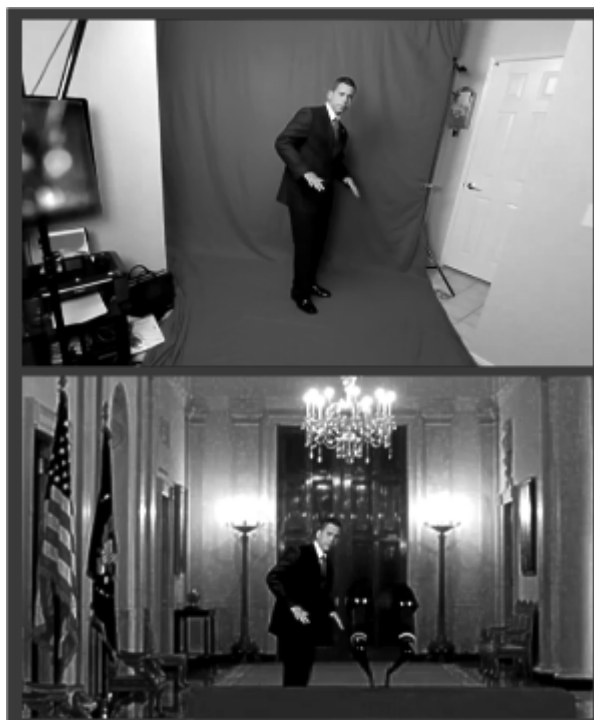
Рис. 3. Приклад застосування технології хромакей