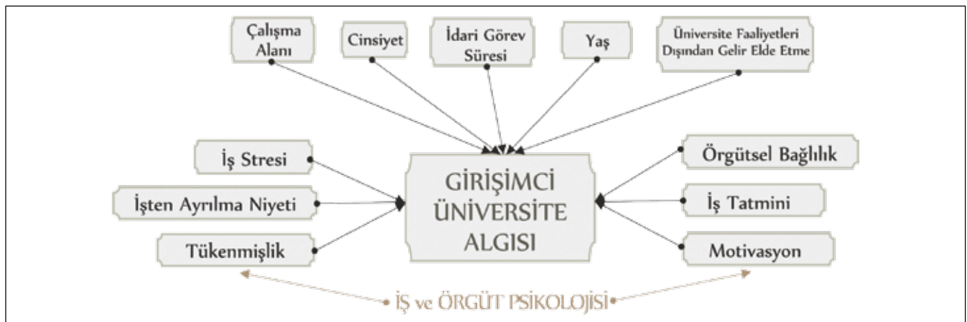
Şekil 3: Araştırmanın kavramsal modeli.

H_{1z} : Akademisyenlerin girişimci üniversite algısı idari görev sürelerine göre farklılık göstermektedir.