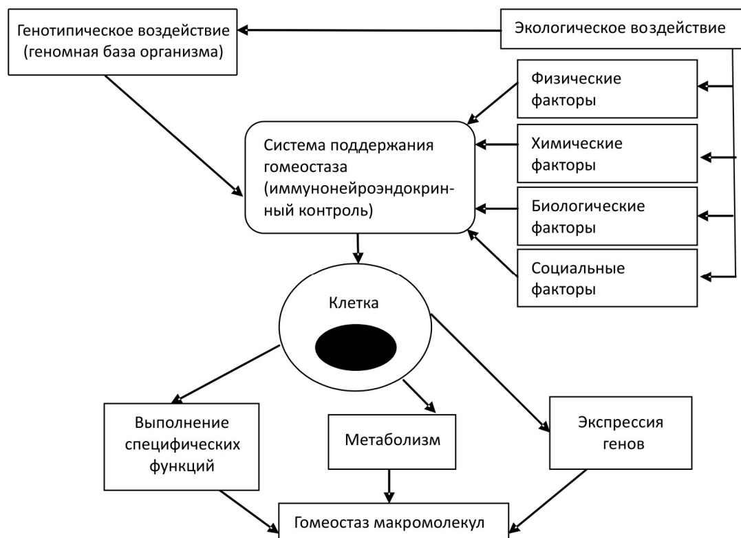
Рис. 2. Экологические воздействия и системы поддержания гомеостаза организма (взято из [20] с изменениями)

3. Возможно создание критериальной базы для диагностики дисрегуляторных изменений интегративных систем как маркеров влияния на здоровье техногенных химических и прочих факторов риска. Необходимо дальнейшее изучение темы комплексной оценки взаимодействия нервной, эндокринной и иммунной систем организма в условиях воздействия техногенного химического загрязнения.