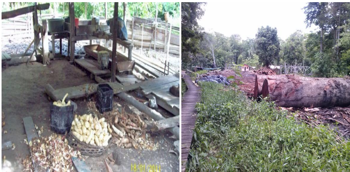
Figura 3A - Produção Artesanal da Farinha e 3B - Extração de Madeira