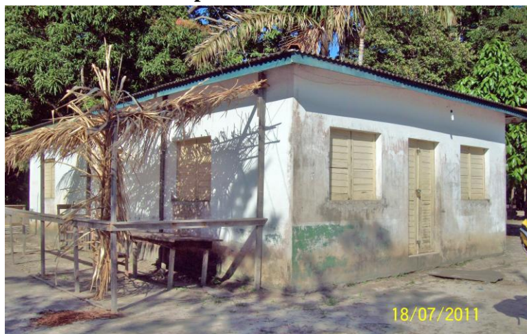
Figura 04: Escola Municipal de Ensino Fundamental Menino Deus

Desse modo, detectou-se que na Comunidade Menino Deus, existe uma escola de ensino fundamental (figura 04), de identificação homônima a da Comunidade. Sua fundação data do ano 2000, sendo antes da fundação oficial apenas uma pequena estrutura coberta com palha, que foi reconstruída durante os anos de 1999 a 2000 pelos próprios moradores. É importante frisar que os primeiros professores contratados pela prefeitura municipal de Portel eram habitantes da Comunidade.