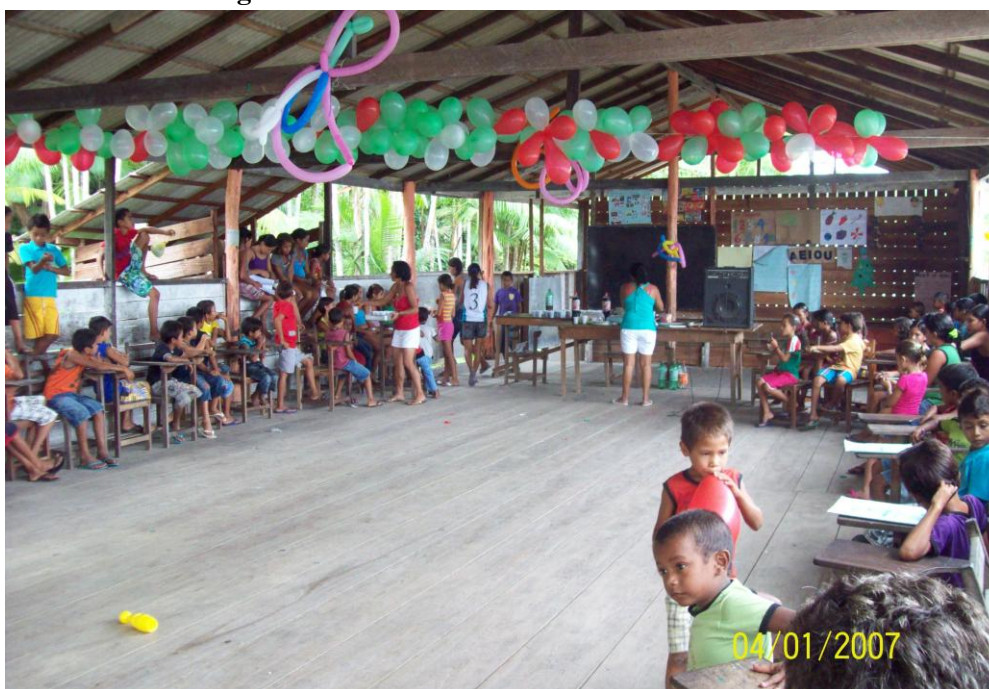
Figura 02 - Sede da Comunidade Menino Deus