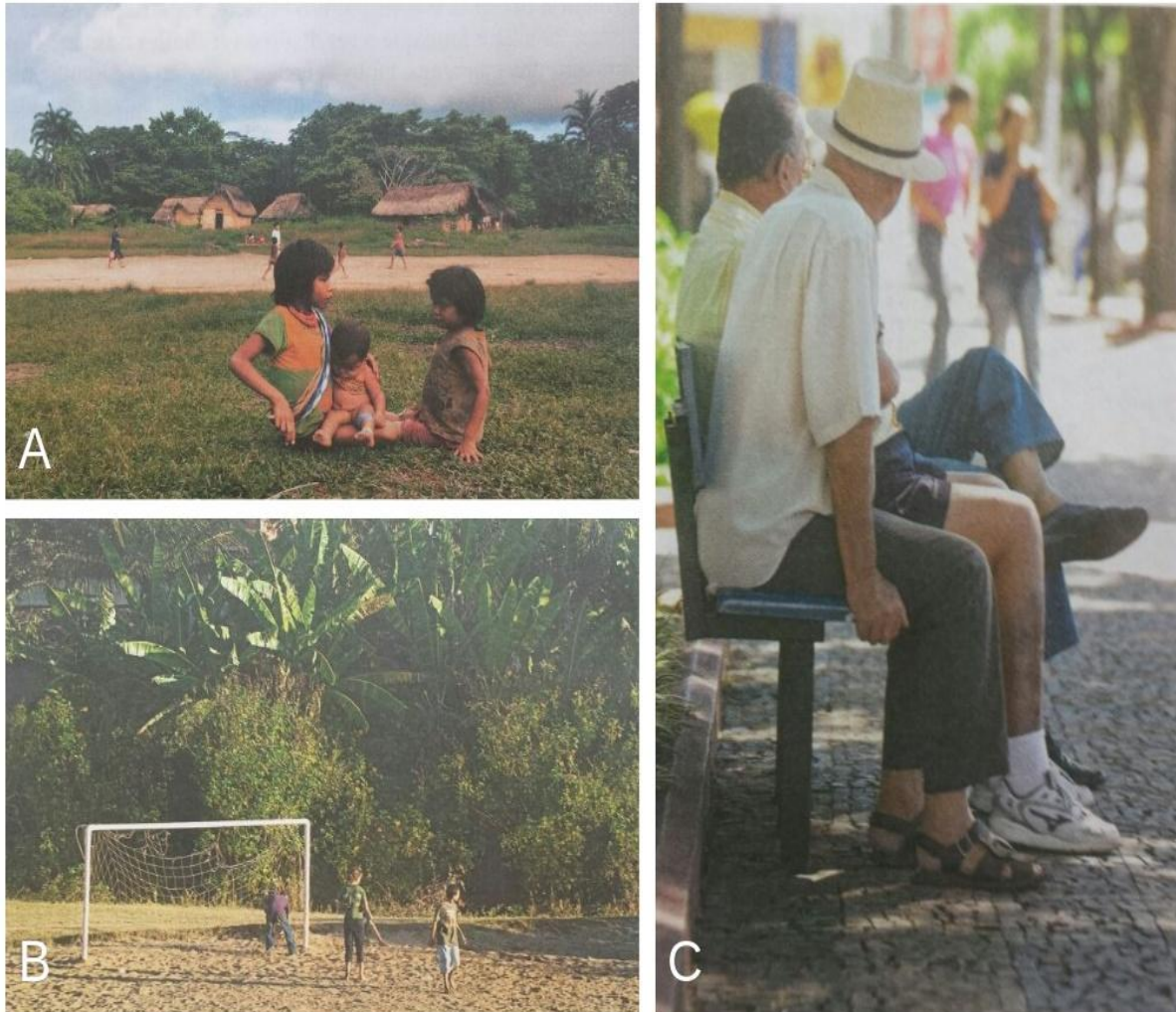
Figura 3 - Imagens relacionadas ao lugar no livro didático

mediação pedagógica para construção de outros conteúdos. Infere-se a partir daí a pouca importância dada pelo autor ao tema.