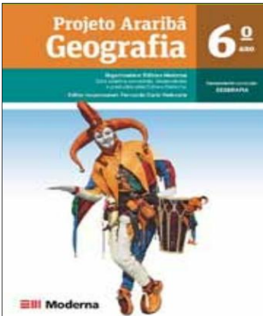
Figura 1 - Capa do livro Projeto Araribá

A capa apresenta a imagem de um Folião do carnaval de Veneza (Itália), o que por si só já é razão de questionamento: trata-se de uma imagem que representa a cultura carnavalesca de outro país, em detrimento das que se relacionam ao lugar Brasil, seja região, estado ou cidade brasileira.