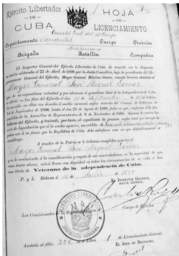
Acta de licenciamiento de José Miguel Gómez libertador