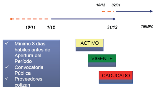
Figura 1. Procedimiento de compras públicas instaurado en la provincia de Mendoza