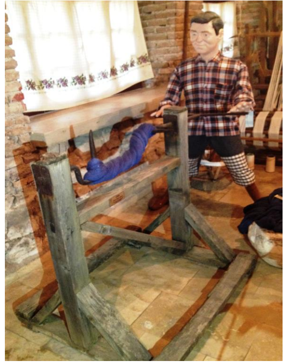
7 (Kişisel Arşiv), "Çöme", 2014.