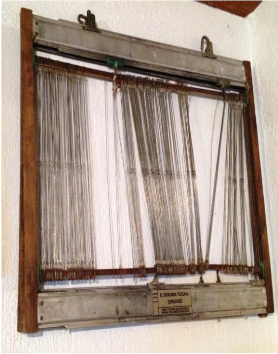
6 (Kişisel Arşiv), "Çerçeve", 2014