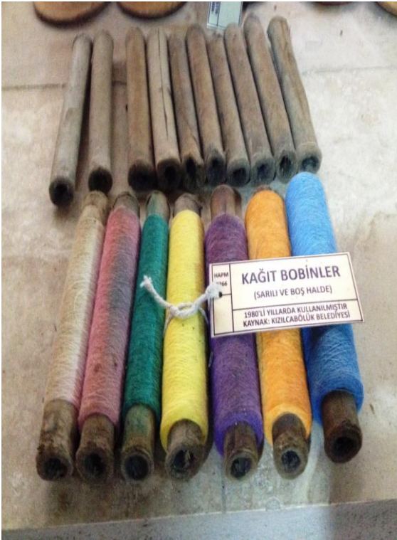
4 (Kişisel Arşiv), "Kağıt Bobin", 2014.