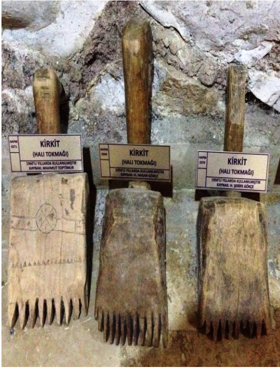
14 (Kişisel Arşiv), "Kirkit", 2014.