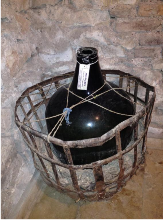
2 (Kişisel Arşiv), "Anilin Şişesi", 2014.