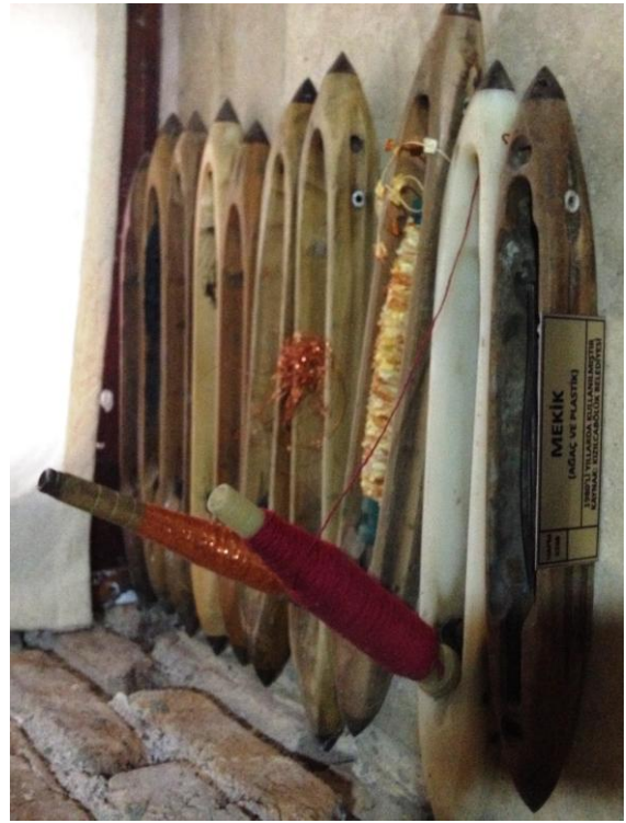
15 (Kişisel Arşiv), "Mekik", 2014.