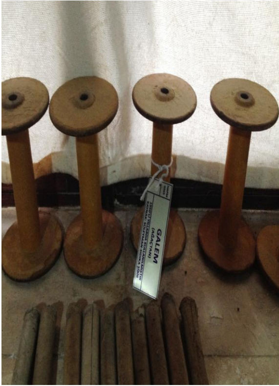
10 (Kişisel Arşiv), "Galem", 2014.