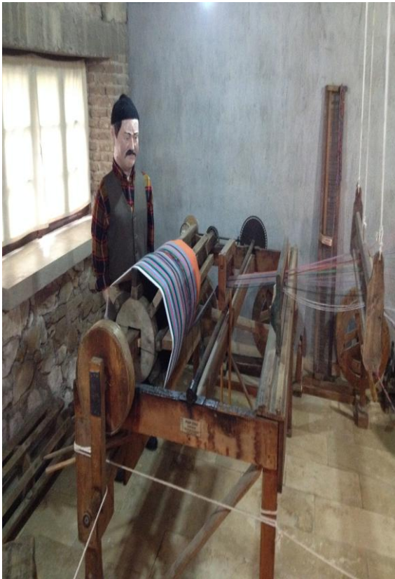
8 (Kişisel Arşiv), "Çözgü", 2014.