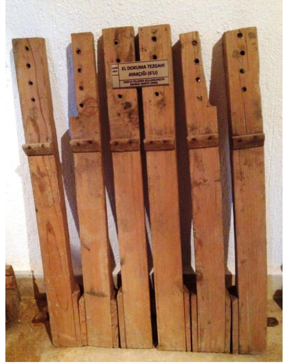
3 "Ayakçık", 2014.