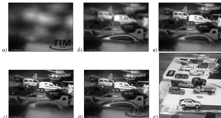
Рис. 4. Обработка изображений более сложной сцены: а, б, в, г – исходные изображения при дальности фокусировки 0,3 м, 0,6 м, 1,2 м, 3,0 м.; д – результат слияния, е – изображение сцены с другого ракурса

На примере обработки последовательности изображений, зарегистрированных с применением цифровых очков ночного видения с электроуправляемым жидкостным объективом при изменении фокусировки от 30 см до 300 см показано, что наиболее эффективным является предложенный комбинированный алгоритм слияния.