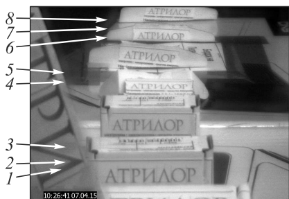
Рис. 3. Слияние на основе пирамиды контрастов и взвешенного суммирования дальностных кадров

Изображение, синтезированное с помощью разработанного комбинированного алгоритма, основанного на пирамиде контрастов (4) – (7), картосхемы дальностей (8), (9) и взвешенном суммировании кадров (10) приведены на рис. 3. Анализ показывает, что предложенный алгоритм слияния наиболее адекватен задаче формирования единого изображения из последовательности дальностных кадров, поскольку он в значительной степени обеспечивает подавление указанных выше артефактов.