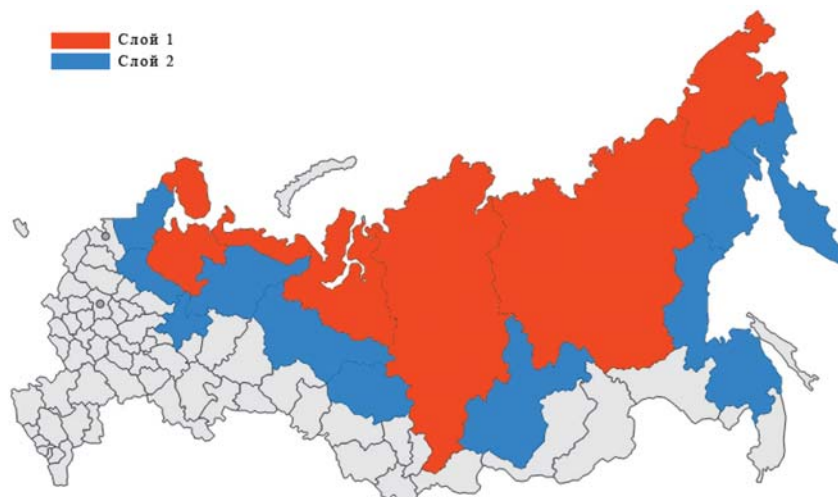
Рис. 4. Выбор слоев для нейросетевой модели

Учитывая корректировки на каждом этапе существования нейронной сети можно всегда иметь акту-