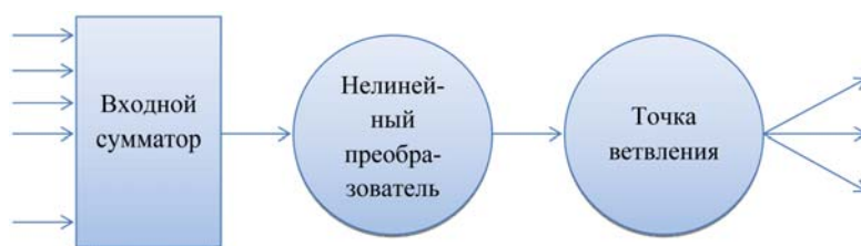
Рис. 1. Общий вид модели нейронной сети

Говоря о математических основах, заметим, что нейрон осуществляет отображение R_n \rightarrow R в соответствии с соотношением для его выхода: