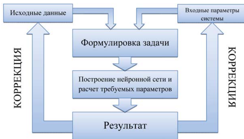
Рис. 5. Вариант построения рекуррентной нейронной сети

альные результаты, способные служить основой для формирования итерационной стратегии развития Арктической зоны.