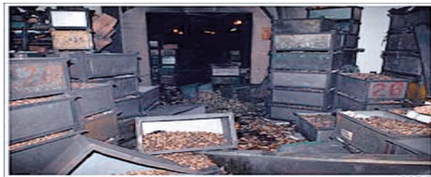
Слика 4 – Ванредни догађај у индустрији за производњу експлозивних средстава

У нашој земљи наменска индустрија за производњу експлозивних средстава налази се у компанијама: „Крушик”, Ваљево; „Прва искра”, Барич; „Слобода”, Чачак; „Милан Благојевић”, Лучани и „Први партизан”, Ужице. У зависности од потреба пословања ових компанија и зараде коју су оствариле продајом и извозом својих финалних производа, врши се модернизација производних капацитета. Потребне за модернизацијом машина за производњу експлозивних средстава много су веће од остварених. Због тога смо, нажалост, имали и ванредне догађаје у наменским индустријама за производњу експлозивних средстава са људским губицима и материјалним штетама (слика 4).