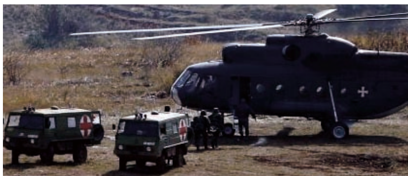
Слика 3 – Ванредни догађај на ИВП „Пасуљанске ливаде” Figure 3 – Emergency at the Pasuljanske livade training field Рис. 3 – Чрезвычайная ситуация ИВП «Пасуляanske ливаде»

Међутим, немили догађај у фабрици „Милан Благојевић” у Лучанима третира се као догађај са позитивним исходом, јер, када се догодила експлозија на преси за производњу ракетних горива, на велику срећу, упркос веома снажној детонацији, није произвео озбиљније повређивање радника. Радници на преси су се придржавали прописа о раду и заштити и захваљујући томе спасили су своје животе. Чињеница је да је то најопаснији део процеса производње, па се тим пресом и управља са удаљености. Радници због тога нису били у погону већ на местима одакле управљају процесом. Суштина рада на оваквим местима јесте да се строго морају поштовати процедуре и прописи. На основу тог поштовања прописа и правила у овом случају су избегнуте веће жртве и оштећења имовине.