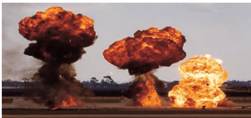
Слика 2 – Појава експлозије експлозивних средстава на одређеном простору Figure 2 – Ordnance explosion at a designated area Рис. 2 – Взрыв боеприпасов на определенной местности

старело експлозивно средство, остало из ратних дана, које под одређеним околностима увек може да експлодира и при томе доведе до одређених људских и материјалних губитака. На основу тога поставља се питање: колико човек који се налази на том простору има осећај личне сигурности? Мисли се, пре свега, на могућност несметаног задовољавања основних физиолошких потреба (исхрана, кретање, одмор, здравље, што је најчешће условљено радом, и прибављање средстава за живот), на неприкосновеност (неповредивост) менталног и физичког интегритета, слободно одлучивање, понашање и испољавање духа и самоафирмације. Укратко, то је стање личне сигурности и заштићености појединца од могуће појаве експлозије експлозивних средстава на одређеном простору (слика 2).