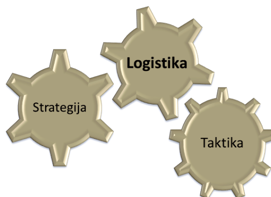
Slika 1 – Ilustracija Mahanovog shvatanja logistike Figure 1 – Illustration of Mahan's concept of logistics Рис. 1 – Иллюстрация концепта логистики по Махану

Napredno razmišljanje Barona Žominija, zasnovano na analizi Napoleonovih ratova, umnogome je uticalo i na druge vojne mislioce, pa je tako admiral Alfred Mahan (1840–1914) prihvatio termin logistika i uveo ga u rečnik mornarice SAD (slika 1). U svojim delima naveo je da „između strategije i velike taktike logično dolazi logistika. Strategija odlučuje gde da se deluje. Logistika je umetnost premeštanja vojske, ona je ta koja dovođi trupe do tačke gde dejstvuju i kontroliše pitanje snabdevanja. Velika taktika je ta koja određuje način bitke” (Mahan, 1918, p.49).