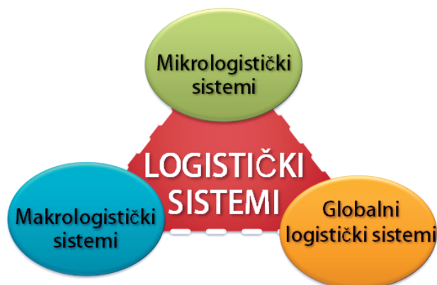
Slika 4 – Prikaz jedne od podela logističkih sistema Figure 4 – Overview of one systematisation of logistic systems Рис. 4 – Некоторые разновидности логистических систем

Mikrologistički sistemi su ona preduzeća – proizvođači različitih proizvoda/usluga, koji se bave optimizacijom kretanja materijalnih i s njima povezanih finansijskih i informacionih tokova i poseduju logistički orijentisanu organizacionu strukturu. U skladu sa ovim određenjem, vojna logistika oružanih snaga jedne države može se posmatrati kao mikrologistički sistem.