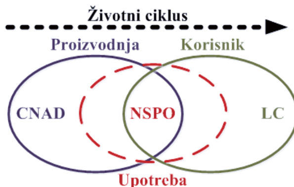
Slika 2 – Domeni životnog ciklusa Figure 2 – Domains of a life cycle Рис. 2 – Этапы жизненного цикла

Tri domena životnog ciklusa i za njih odgovorna NATO tela prikazana su na slici 2. Budući da tri domena moraju da funkcionišu povezano između proizvođača i korisnika, tu su i dva dodata aspekta koja moraju da deluju u skladu sa logističkim funkcijama koje se izvršavaju: kooperativna logistika i multinacionalna logistika.