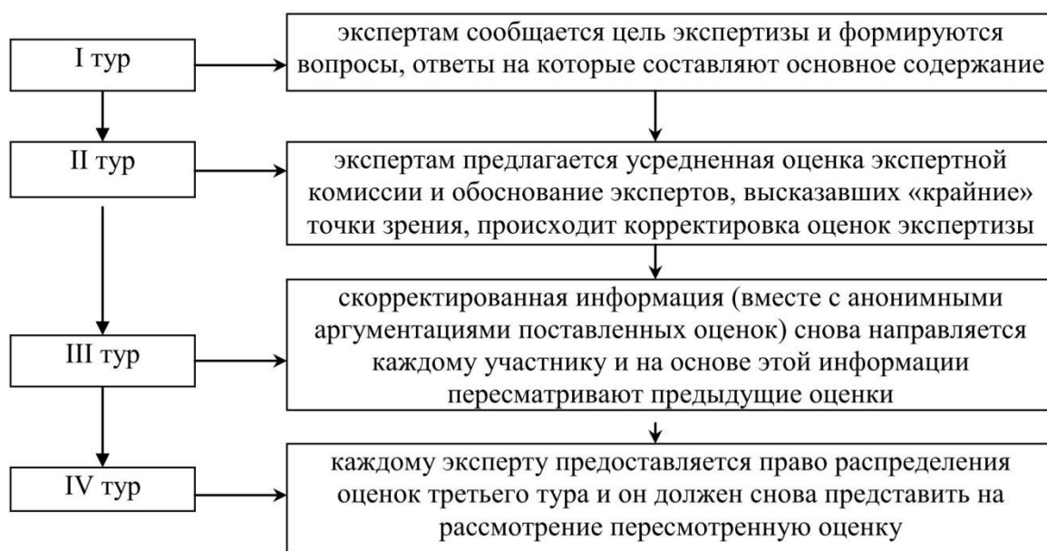
Рисунок 3 – Обратная связь метода «Дельфи»[3]

На рисунке 3 представлены основные этапы осуществления обратной связи при использовании метода Дельфи.