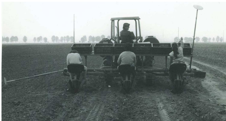
Fig. 4 - Planting machine PLANT, during the work / Mașina de plantat PLANT, în lucru