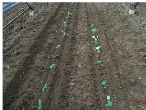
Fig. 3 - Planting machine MPS, during the work / Mașina de plantat MPS în lucru