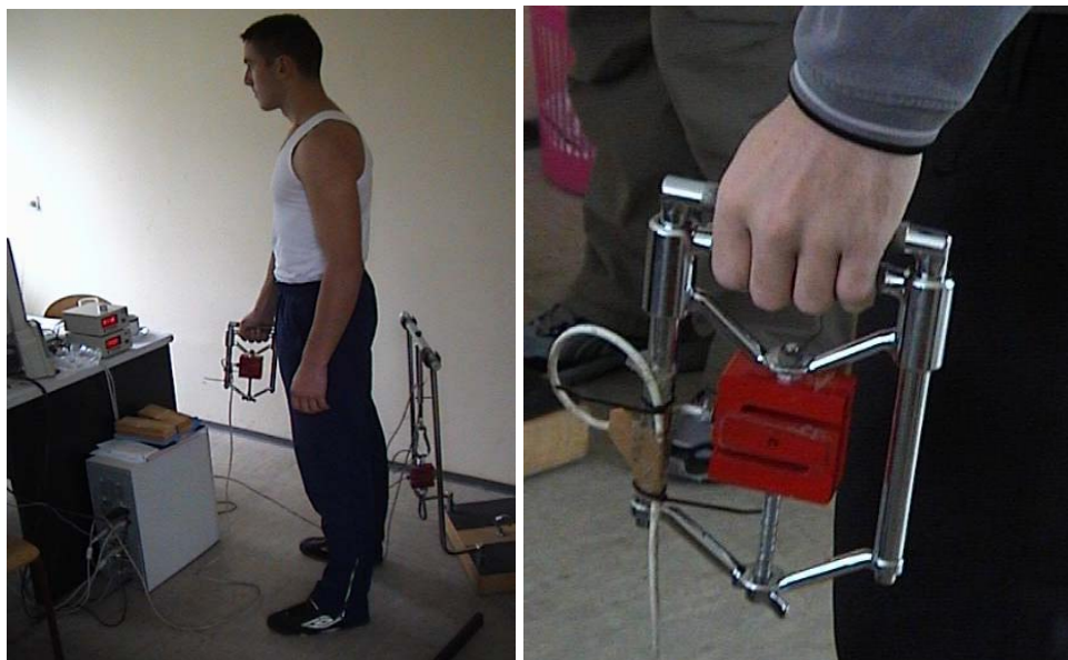
Slika 1. Merni uređaj i konstrukcija za procenu sile stiska šake sa pozicijom izvođenja testa