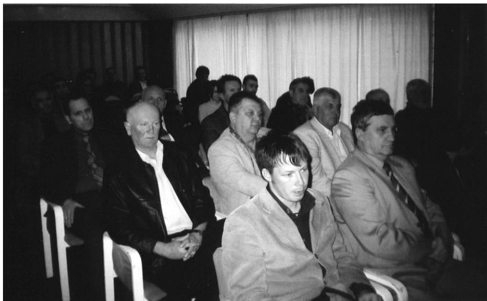
Pažnja je bila stalno prisutna

Key words: sport, PR in sport, management, marketing in sport, sport organization, strategy, function.