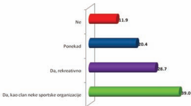
Grafik 3: Da li se bavite nekom fizičkom aktivnošću?

Od ukupnog broja ispitanika njih 54.7% se bavi nekim sportom, dok se 45.3% ne bavi sportom. Od ukupnog broja ispitanika iz šestog razreda njih 52.6% se bavi sportom. Najveći procenat ispitanika koji se bavi sportom je iz osmog razreda i to 60.9%, dok je najmanji procenat učenika devetog razreda koji se bave sportom i to 49.5%.