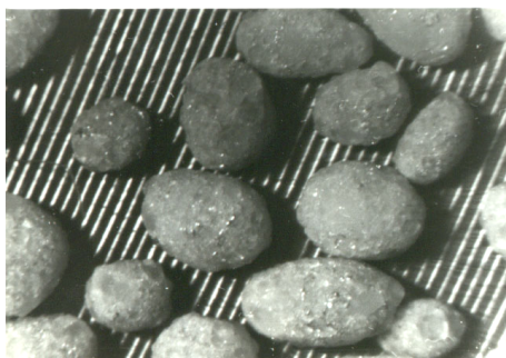
Slika 1 – Izgled granula trokomponentne smeše (RDX, PS, Al),

Na slici 1 prikazane su granule trokomponentne smeše heksogena (80% m/m), polistirena (5% m/m) i aluminijuma (15% m/m).