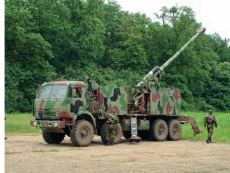
Slika 11 – PT oruđa 155 mm NORA-B52 na vatrenom položaju

The vehicle chassis is lifted from the ground – rigid suspension system concept of the weapon platform