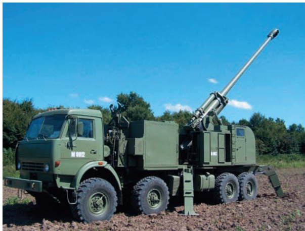
Slika 4 – Samohodna top-haubica 155 mm NORA-B52 iz serijske proizvodnje Figure 4 – 155 mm Self-Propelled NORA-B52 from serial production

poruke partije/serije oruđa i municije vršena je u zemlji kupca funkcionalna provera sistema oruđa i obuka osoblja kupca, a posle isporuke prve i treće partije oruđa izvršena su ispitivanja gađanjem radi verifikacije funkcije i definitivnog prijema balističkog sistema oruđa, municije i SKUV.