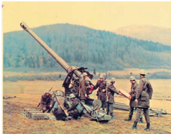
Figure 7 – 152 mm M84 Towed Gun-Howitzer Photo taken during military troop firing tests