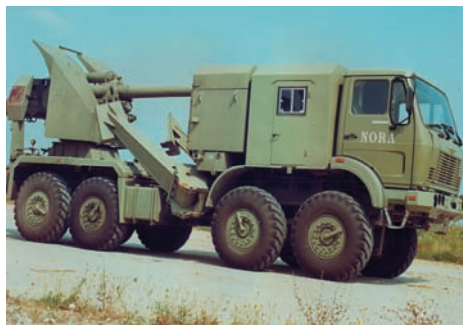
Slika 8 – FM oruđa 152 mm NORA-B u položaju za marš. Iza kabine vozača (sa komandirom) je kabina za ostala četiri člana posade

f) da se komunikacija komandira sa nišandžijom i ostalim članovima posade održava interfonskom opremom.