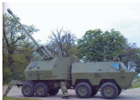
Slika 15 – Samohodno oruđe NORA-B52-verzija K1 u borbenom položaju Oklopljenost sklopa naoružanja je suvišna. Zadržati oblik prednjeg dela oruđa za smeštaj posade

False dilemma for designers and users – open mounted armament or turret mounted armament? Two turrets mounted on one chassis – Why?