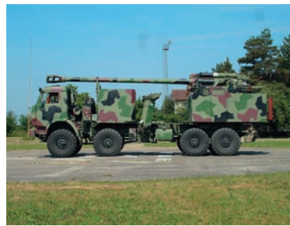
Slika 9 – PT oruđa 155 mm NORA-B52 spreman za marš. Uočavaju se bitne izmene koncepcije i konstrukcije rešenja u odnosu na FM oruđa NORA-B