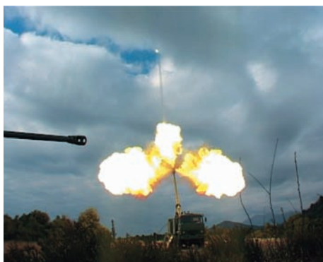
Slika 13 – Ispitivanje jednog od serijskih oruđa 155 mm NORA-B52 pre isporuke kupcu – februara 2007. godine.

Opit gađanja na maksimalni domet sa projektilom ERFB-BB na poligonu Crni Rt u Crnoj Gori (vidljiv je plamen gasova na ustima cevi i trag sagorevanja goriva generatora gasa)