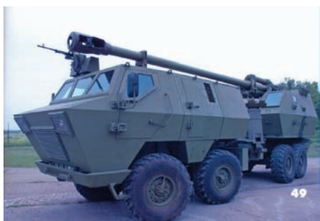
Slika 14 – Samohodno oruđe NORA-B52-verzija K1 u marševskom položaju Lažna dilema za projektante i korisnike – otvorena ili kupolna ugradnja? Dve kupole na jednoj šasiji – zašto?

Ukoliko je navedena zaštita sprovedena (a čak i da jeste ona nije dovoljna) masa oruđa je povećana za više od 6000 kg, te se neminovno nameće potreba projektovanja specijalne šasije vozila, jer nijedno vojno terensko vozilo 8x8 nije projektovano za tako velika opterećenja prednjih i zadnjih mostova vozila. Povećana masa vozila bitno će smanjiti prohodnost vozila pri kretanju na terenu (konstatacija da je povećana mobilnost oruđa ne može da bude tačna!), a biće smanjena i brzina kretanja na putevima (i podatak o maksimalnoj brzini od 90 km/h treba uzeti sa rezervom). O radnom veku i pouzdanosti nesumnjivo preopterećene kamionske šasije ne treba ni govoriti. Očigledno je, dakle, da je insistiranje na oklopnoj zaštiti u koliziji sa potrebom ponderisane optimizacije svih uticajnih borbenih karakteristika sistema oruđa, a potpuno neprihvatljiva sa stanovišta cena–efikasnost. Uostalom, teško je naći relevantno taktičko opravdanje za koncepciju i filozofiju borbene upotrebe artiljerijskog sistema čiji je domet veći od 40 km u uslovima urbanog ratovanja ili bilo koje druge situacije u kojoj će biti izložen dejstvu streljačke municije. 42 Posebno je problematična zaštita od dejstva protivtenkovskih mina klasične kamionske šasije koja nema nikakvu podnu oblogu niti nezavisno oslanjanje točkova!