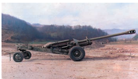
Slika 1 – Konvertovani top 155 mm M46/84 spreman za marš Figure 1 – 155 mm M46/84 Converted Gun ready for transportation

probne partije oruđa i municije, sistem vučene top-haubice 152 mm NO-RA-A usvojen je za operativnu upotrebu u JNA kao model M84. Tako je domaćim razvojem osvojena serijska proizvodnja artiljerijskog sistema druge generacije, koji je u to vreme bio na nivou rešenja američke vučene haubice 155 mm M198, a tek nekoliko godina kasnije u bivšem SSSR-u se u toj kategoriji pojavila vučena haubica 152 mm 2A65 (pod kodnom oznakom MSTA-B).