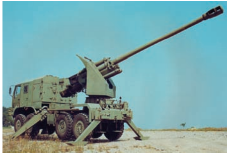
Slika 10 – FM oruđa 152 mm NORA-B na vatrenom položaju Šasija vozila je potpuno podignuta sa tla – koncept krutog oslanjanja platforme oruđa sa naoružanjem