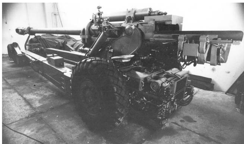
Slika 3 – Samopokretna top-haubica 152 mm NORA-C3, bočni pogled Figure 3 – 152 mm Gun-Howitzer NORA-C3 with APU, lateral view

ća postojeća elevacija cevi (sa 45^{\circ} na 65^{\circ} ) i da se ugrade elementi novih sklopova za poluautomatsko (hidraulično) pokretanje cevi po elevaciji i pravcu i poluautomatsko potiskivanje projektila u ležište metka (sa hidrauličkim dovodjenjem na osu punjenja, ubacivanjem projektila i čaure u komoru i potiskivanjem projektila u cev silom potrebnom za urezivanje vodećeg prstena projektila u žljebljeni deo cevi). Projektovani su novi sklopovi donjeg lafeta, krakova i hodnog dela oruđa, 14 da bi se obezbedila ugradnja pomoćne pogonske grupe (dizel motor nominalne snage 54 kW 15 i hidromotori), komponenta za razvod snage, elemenata za upravljanje glavnim i pomoćnim točkovima (levi i desni, na kracima lafeta), hidropneumatskog sistema za oslanjanja točkova (koji je korišćen za spuštavanje oruđa na tlo pri pripremi za gađanje i prevođenje u marševski položaj), sedišta i komandne table vozača, podsklopova za poluautomatsko (hidraulično) pokretanje krakova lafeta pri prevođenju oruđa iz marševskog u borbeni položaj i obratno.