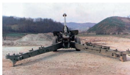
Slika 2 – Konvertovani top 155 mm M46/84 u položaju za gađanje Figure 2 – 155 mm M46/84 Converted Gun in firing position

Počev od 1983. godine, u saradnji sa stranom firmom SRC, 8 razvijen je konvertovani top 155 mm M46/84. Saradnja sa firmom SRC obuhvatala je: konverziju topa 130 mm M46 ugradnjom modernizacionog kompleta čiju osnovu čini cev 155 mm dužine 45 kalibara sa barutnom komorom oko 23 dm 3 ; osvajanje proizvodnje projektila tipa ERFB-BT, 9 ERFB-BB 10 i generatora gasa po licencnoj dokumentaciji dobijenoj po ugovoru sa firmom SRC; osvajanje novih barutnih punjenja M11 i M2 za novoprojektovanu produženu mesinganu čauru i projektile 155 mm ERFB (po dokumentaciji SRC). Primenjenim balističkim rešenjem sa projektilom ERFB-BB iz konvertovanog topa dobijen je najveći domet od 39 km (ostvareno povećanje dometa je oko 45% veće od dometa topa M46) [4]. Time je dostignut svetski trend razvoja u oblasti vatrene podrške i stvorene su mogućnosti da se potencijalnim kupcima ponudi artiljerijski sistem treće generacije (balistički sistem sa dužinom cevi 45 kalibara, zapremine barutne komore 23 dm 3 ).