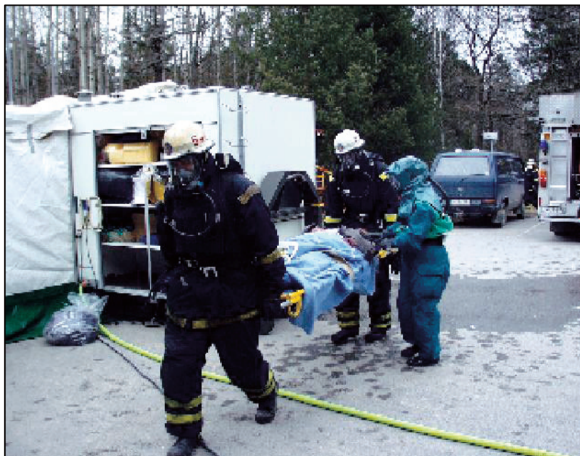
Слика 5 – Евакуација повређених и оболелих при хемијском удесу Figure 5 – Evacuation of the injured and contaminated in a chemical accident Рис. 5 – Эвакуация пострадавших при химической аварии

У састав снага за уклањање последица укључују се: јединице АБХО (хемијско извиђање рејона и деконтаминација), инжењеријске јединице (рашчишћавање препрека, скидање слоја земље), логистичке јединице (обезбеђење хране, воде и осталих средстава), јединице ваздухопловства и противваздухопловне одбране (извиђање и интервенције у рејонима високе контаминације), јединице војне полиције (одржавање реда, регулисање саобраћаја) и друге. Од ових снага могу се формирати посебни привремени састави (групе, одреди и сл.), при чему се санитетско збрињавање повређених (слика 5) обавља у гарнизонским амбулантама, војним и градским болницама и ВМА.