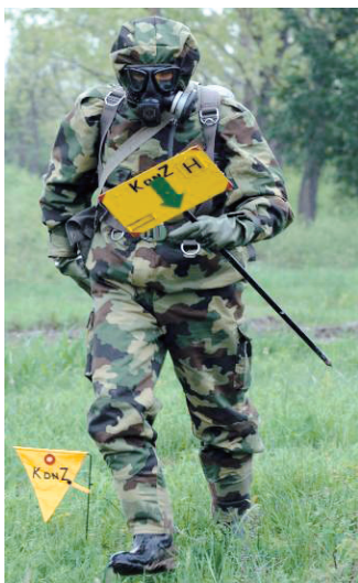
Слика 1 – Успостављање КЗС Figure 1 – Establishing CPS Рис 1 – Установка СЧС

Тежишна мера контроле ванредне ситуације јесте хемијско извиђање које обухвата: откривање, детекцију и идентификацију токсичних материја, праћење и утврђивање граница контаминираниог земљишта (КонЗ-а), давање сигнала хемијске опасности, контролно-заштитну службу – КЗС (слика 1) и израду и достављање извештаја са хемијског извиђања.