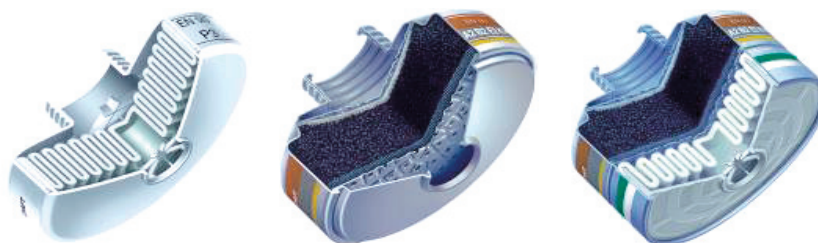
Слика 4 – Специјална цедила за заштиту од токсичних и индустријских хемикалија Figure 4 – Special filters for the protection from toxic and industrial chemicals Рис. 4 – Специальные фильтры для защиты от токсичных химических веществ

То се, пре свега, односи на цедила заштитне маске (слика 4), изолационе апарате, специјална возила за извиђање са филтровентиляционим уређајима и др. Преглед специјалних цедила за заштиту од токсичних и индустријских хемикалија приказан је у табели 1.