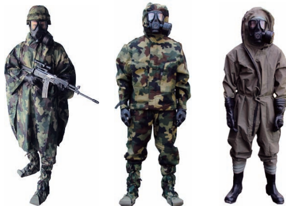
Слика 2 – Формацијска средства НХБ заштите Figure 2 – NBC protection equipment Рис. 2 – Спецформа для защиты от РХБ воздействия

Специфичност хемијске заштите у условима хемијских удеса огледа се у томе да средства која су у опреми Војске Србије (слика 2) не штите успешно у свим условима и случајевима специфичне контаминације. Зато се намеће потреба да се јединице и установе ВС опремају специјалним средствима заштите (слика 3) која су неопходна за извршавање задатака и других активности у примарно и накнадно захваћеном рејону.