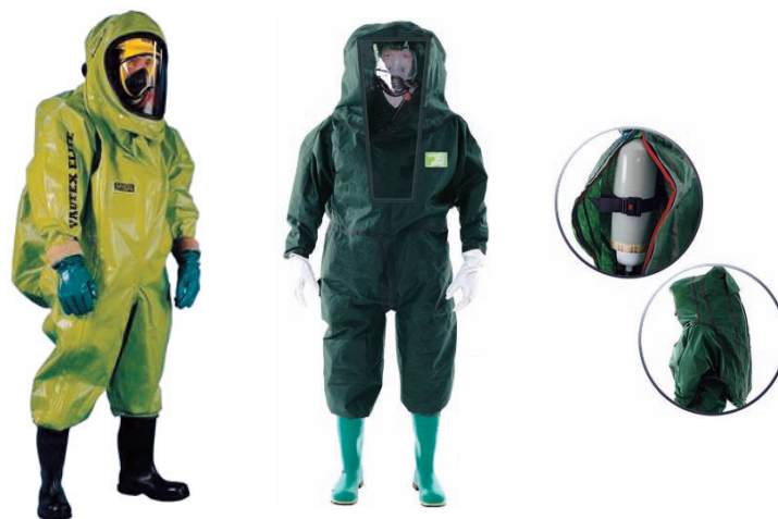
Слика 3 – Специјална средства НХБ заштите Figure 3 – Special NBC protection equipment Рис. 3 – Спецсредства для защиты от РХБ воздействия

То се, пре свега, односи на цедила заштитне маске (слика 4), изолационе апарате, специјална возила за извиђање са филтровентиляционим уређајима и др. Преглед специјалних цедила за заштиту од токсичних и индустријских хемикалија приказан је у табели 1.