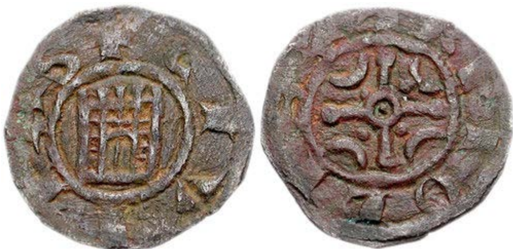
Рис. 7. Медная монета Раймонда III отчеканенная в период 1152–1187 (Metcalf, 1983: 526-7).