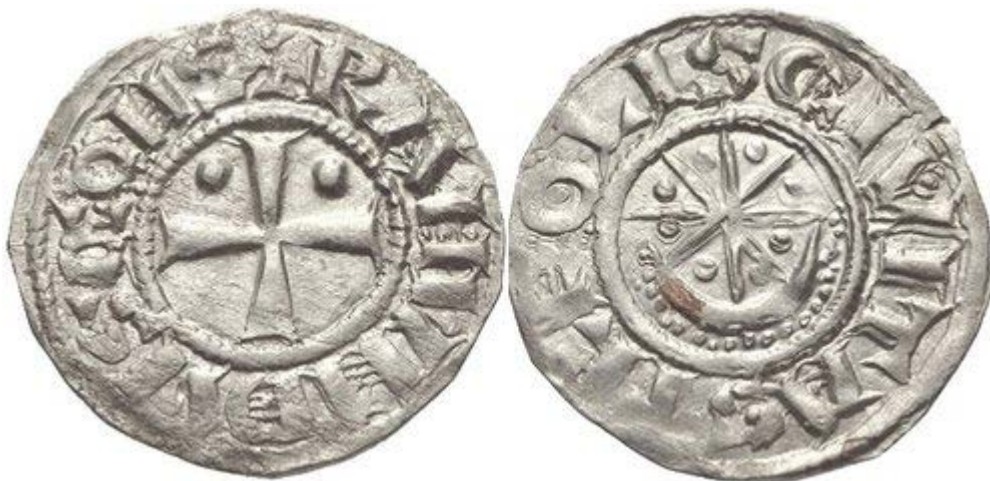
Рис. 2. Серебряная монета графа Раймонда II или III в период с 1149 по 1164 ( Metcalf, 1983: 508-9 ).