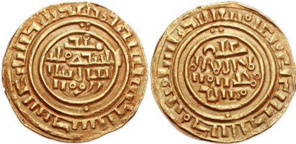
Рис. 1. Золотая монета отчеканенная в период с 1148 по 1187. Монета носит имя Фатимидского халифа аль-Мустансира ( Coinage of Frankish: 116 ).