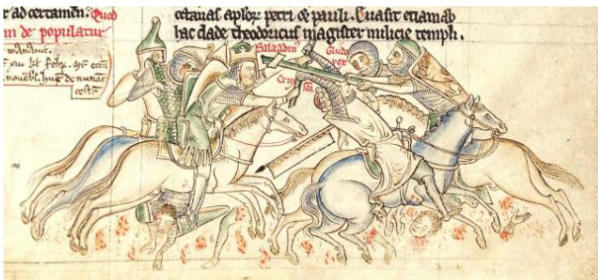
Рис. 8. Раймонд III помогает своему королю в битве при Хаттине