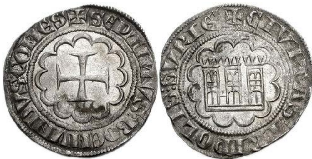
Рис. 4. Серебряная монета графа Боэмунда VII выпущенная в период с 1275 по 1287 ( Markowitz: 497-9 ).