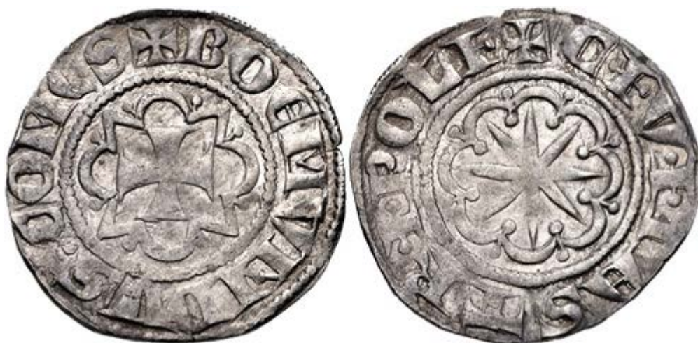
Рис. 3. Серебряная монета графа Боэмунда VI выпущенная в период с 1268 по 1275 ( Metcalf, 1983: 491 ).