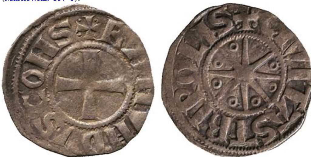
Рис. 5. Серебряная монета периода правления Раймонда III (1150–1187) ( Metcalf, 1983: 519 ).