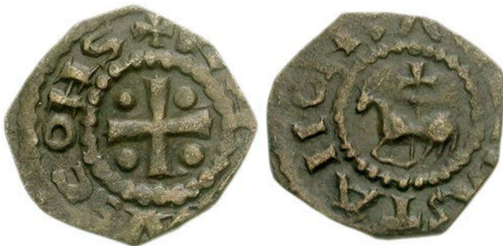
Рис. 6. Медная монета периода правления Раймонда II (1137–1152) с изображением лошади (Metcalf, 1983: 506)