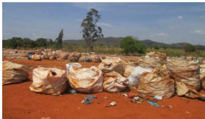
Figura 03 - Material reciclável retirado do lixão de Uruaçu