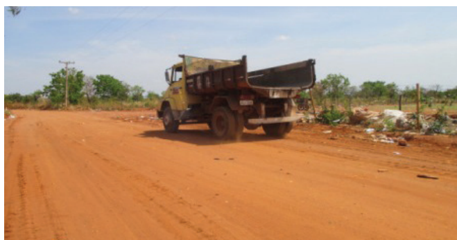
Figura 05 - Máquinas trabalhando no lixão de Uruaçu