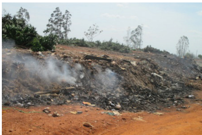
Figura 04 - Queimada de lixo no lixão de Uruaçu

Em observação in loco , percebeu-se que os municípios de Uruaçu, Ceres e Rubiataba mantêm no local máquinas para remoção, compactação e aterramento dos resíduos, mostrando-se preocupados com a proliferação de vetores de doenças (Figura 05 e 06).