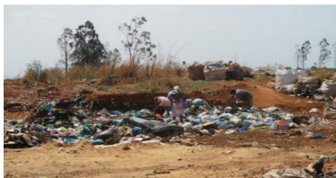
Figura 02 - Catadores de lixo trabalhando sem nenhuma proteção. Município de Uruaçu-GO

necessários à sua proteção como, botas, luvas e máscaras. In loco observou-se que pouquíssimos trabalhadores utilizavam EPI, no máximo utilizavam luvas. Em conversas, afirmaram que, “a bota de plástico e a máscara aumentam o calor, por isso não as utilizam. As luvas às vezes se utiliza, mas pouco adianta”. Cerca de 10 entrevistados mostraram as mãos cortadas ou perfuradas no manuseio dos resíduos. Em nenhum momento o pesquisador percebeu uma preocupação com a insalubridade física e de saúde dos trabalhadores.