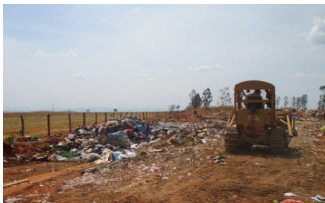
Figura 06 - Máquinas trabalhando no lixão de Uruaçu

Na atual área onde ocorre a disposição dos resíduos sólidos, não existiu um estudo de impactos ambientais (Tabela 3). A distância média dos corpos d'água superficial, varia de 300 m a 2000 m (Tabela 02). Atualmente as prefeituras não realizam um monitoramento da qualidade das águas na proximidade das CDRS. Empiricamente os SMMA acreditam que, pela proximidade de corpos d'água superficial e subterrânea, pode haver contaminação.