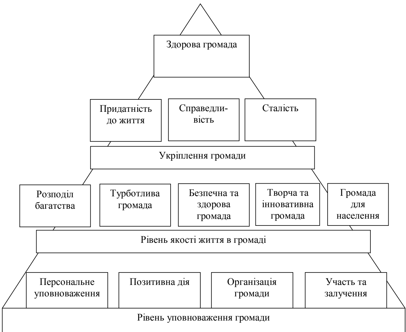
Рис. 1. Піраміда результатів розвитку громади

Ф. Філіпс та Р. Пітман з огляду на це визначають розвиток громади як процес розбудови та посилення спроможності діяти колективно і, в результаті здійснення колективної дії, поліпшити громаду в будь-якій або усіх сферах: фізичній, екологічній, культурній, соціальній, політичній, економічній тощо» [3, с. 6].