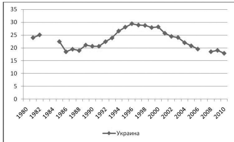
Рис. 1. Динаміка рівня самогубств в Україні за 1980-2010 роки.

Згідно з даними 2012 року, показники смертності через самогубство в Україні сягнули більше 9 тисяч людей (20 людей на 100 000 за рік), що поставило Україну на десяте місце серед усіх країн світу за кількістю на 100 тисяч осіб [10], тоді як у 2009 році Україна посідала 13 позицію. В той же час, за даними на 2015, на кожні 100 тисяч населення країни приходиться 22 самогубства.